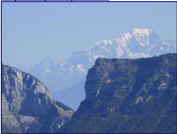
Zoom sur le col de l'Alpette depuis le petit Som.