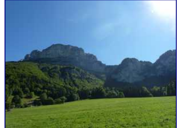
De retour à la Plagne, vue sur le col de l'Alpette.

Le col de l'Alpette est une des portes d'accès aux Hauts de Chartreuse (avec le col de l'Alpe coté vallée du Grésivaudan et le vallon du Pratcel depuis St Pierre de Chartreuse).