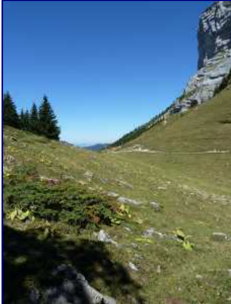
Dans le rétro, le col de l'Alpette.