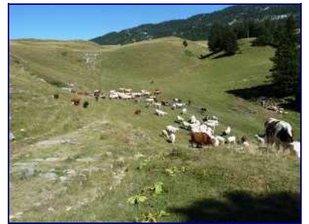
Sur le chemin du retour, troupeau de vache à viande au niveau du col.