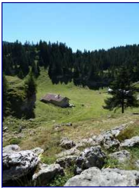
A quelques centaines de mètres du col, la cabane de l'Alpette.