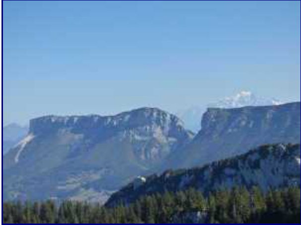
Le Granier ( avec l'éboulement de 2016) et col de l'Alpette depuis le petit Som.