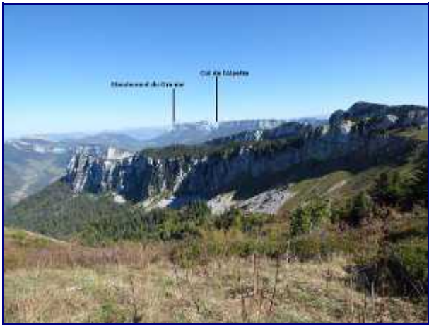
Le Granier et col de l'Alpette depuis le petit Som. Octobre 2018.