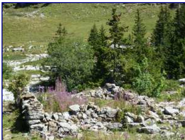
Ruines des chalets de Haberts de Barraux.

Après quelques lacets sous les barres rocheuses, vous arrivez au col.