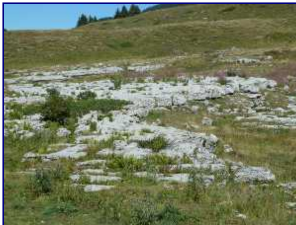
Plus au sud, dalle de pierre et lapiaz.

Laissez à gauche le chemin qui mène au Mont Granier par la Balme à Colon. C'est un retour possible du Granier mais c'est bien plus long..