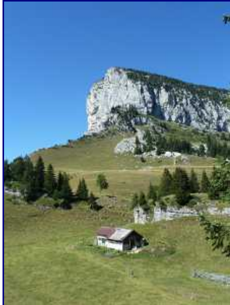
La cabane de l'Alpette, qui ressemble plus à un chalet !

Du hameau de La Plagne, prenez le chemin vers le col de l'Alpette.