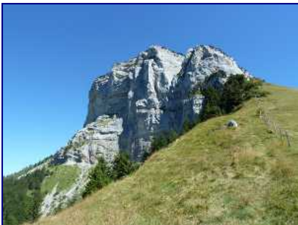
Au col de l'Alpette, altitude 1547 m.

De nos gites, il faut compter 1h15 pour une soixantaine de km.