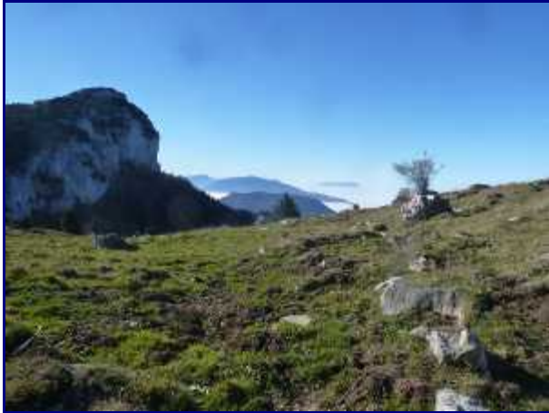
Le crêt des Outalays. A gauche, la tête du Parmelan.

De nos gites, rejoindre Annecy par le col de Leschaux puis, de l'autre côté d'Annecy, rejoindre le village de Villaz (au lieu-dit ' Disonche ') ou d'Aviernoz.