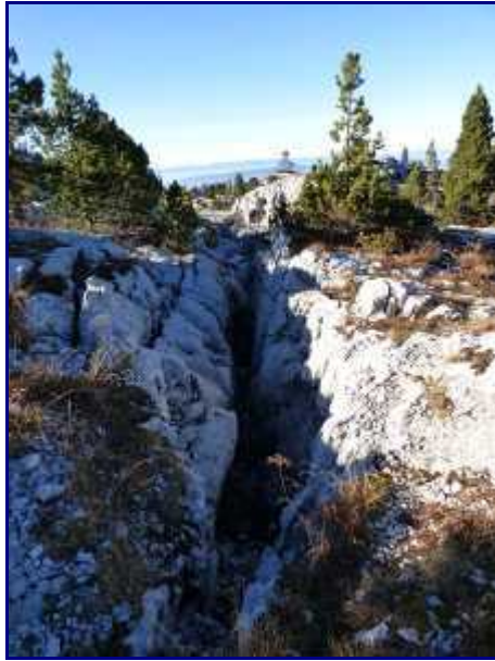
Encore des failles sur le parcours.