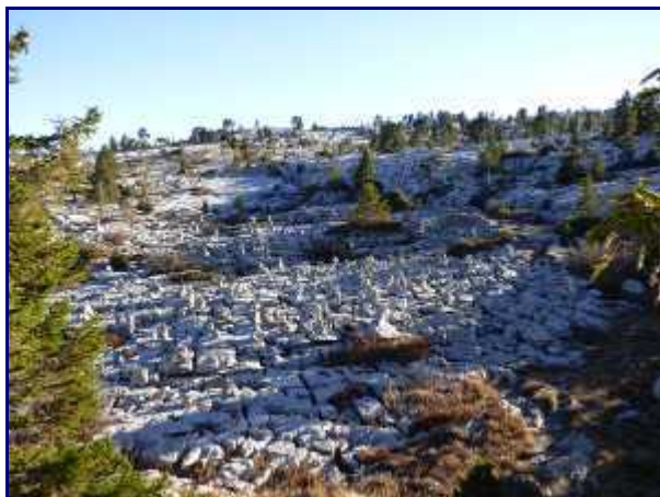
'Forêt de cairns' sur le chemin du retour sur les lapiaz.

Le retour en boucle par la zone des lapiaz, avec failles et petites marches est plus long. Pour les personnes aux pas incertains ou les jeunes enfants, en tenir compte pour le timing.