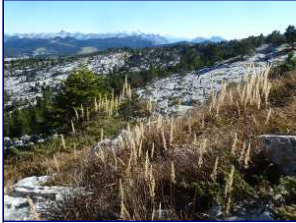
Automne au Parmelan.