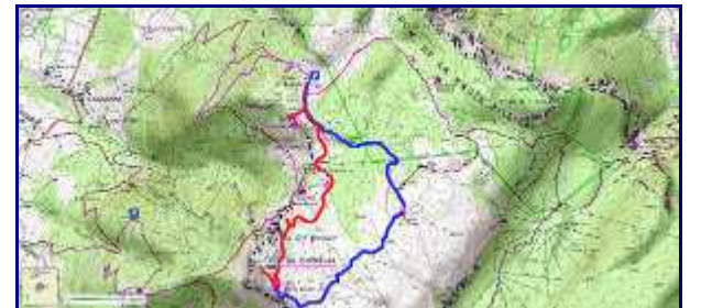
Plan de la rando. En rouge, la montée et en bleu, le retour par les lapiaz.

De nos gîtes, il faut environ une heure pour rejoindre Villaz et un quart d'heure pour monter au parking.