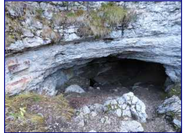
Grotte de la Diau.

Le cheminement est bien marqué par des marques de peinture (ne pas l'emprunter s'il y a de la neige !).