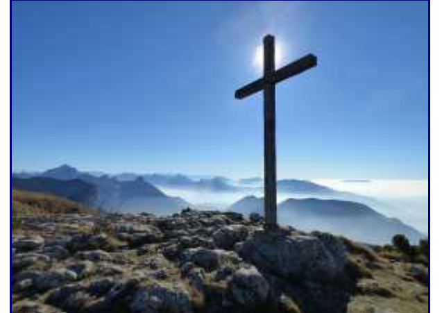
La croix du Parmelan sur fond de Massif des Bauges.