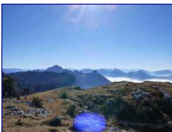
Du sommet, la Tournette puis les Bauges.

Plus près de nos gites situés au Chatelard, vous pouvez en voir sur le sentier découverte des Tannes et glacières à Margériaz.