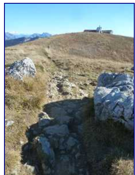
Le refuge du Parmelan ( appelé aussi refuge Camille Dunand).

De là, on monte facilement au refuge et à la croix, point culminant.