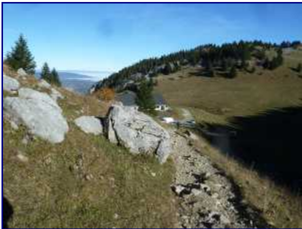
Dans le rétro, le refuge de l'Angletaz (1500m).

PS : Diaporama maxi-taille en cliquant sur les photos + roulette de la souris (ou flèches) pour le défilement.