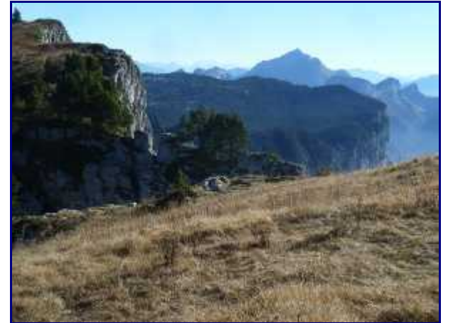
La Tournette, vue du Parmelan.