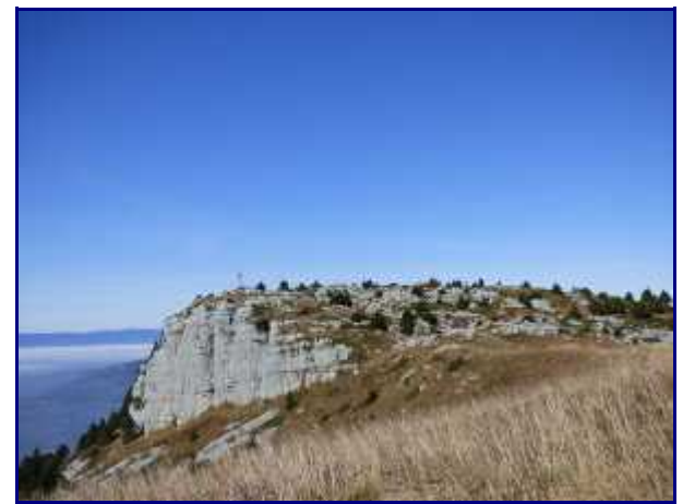
Au nord-ouest du refuge, la croix du Parmelan (1832m).