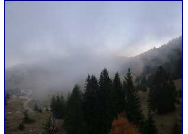
Les brumes de fin de journée arrivent.