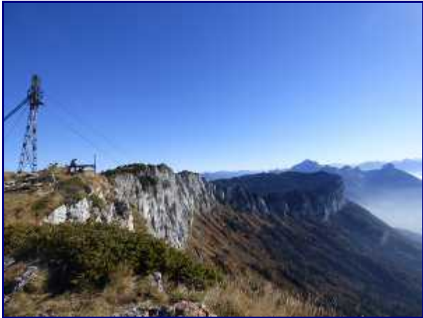
La crête du Parmelan. Au premier plan, le pylone d'arrivée pour l'approvisionnement du refuge. Au fond, la Tournette (2351m) et les dents de Lanfon (1824m).