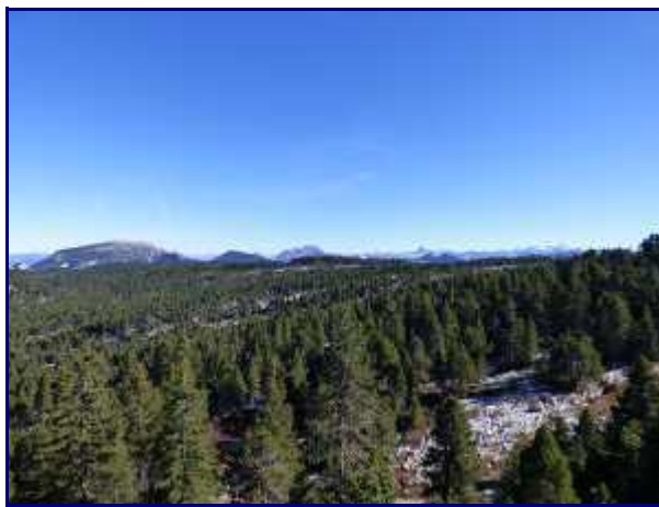
La partie nord du plateau du Parmelan, assez boisé.

NB : Lien pour télécharger le topo de la rando au Parmelan , après Annecy, en Pdf.