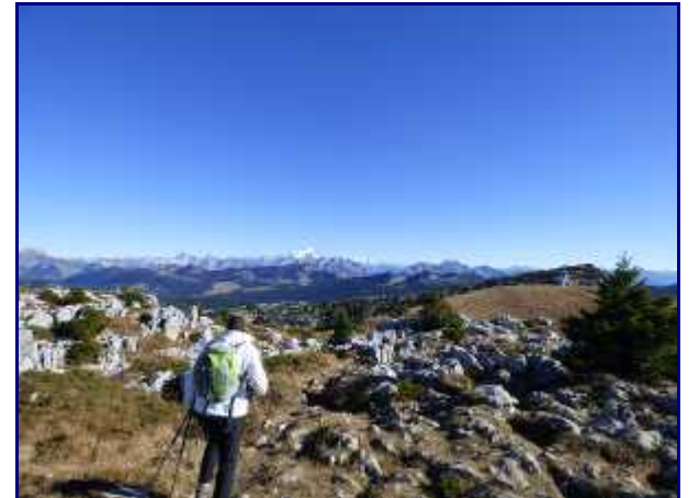
De la croix, vue à l'est.

On rejoint plus loin le sentier du Petit Montoir (1584m) qui vient de Villaz.