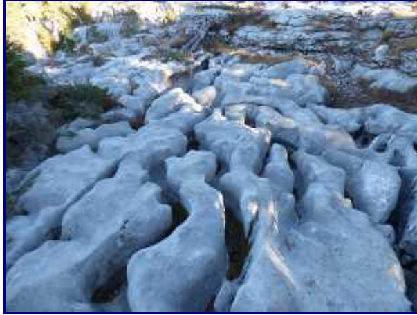
Superbes lapiaz émousés sur le plateau du Parmelan.

Pour le retour, vous avez deux options: revenir sur vos pas ou traverser les lapiaz.