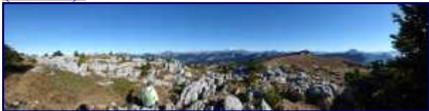
Panorama depuis la croix du Parmelan.