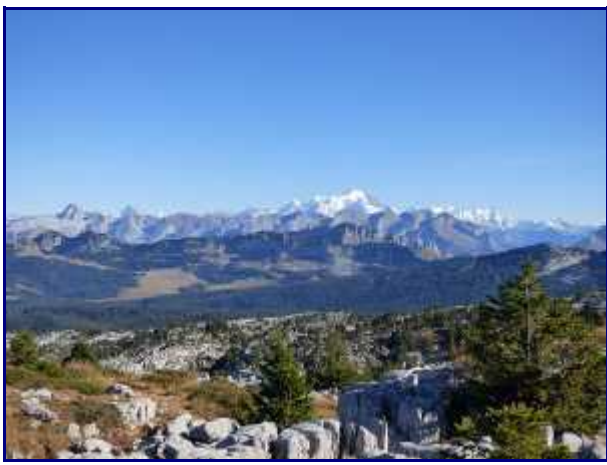
Le Mont Blanc. Devant, les Aravis avec tous ses sommets.