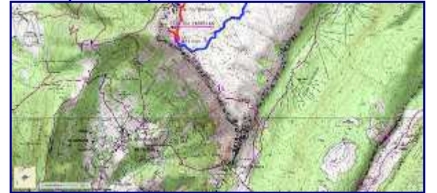
Plan de la rando. En rouge, la montée et en bleu, le retour par les lapiaz.