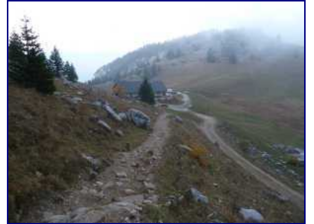
Retour au parking, la nuit se fait proche.

De nos gîtes, il faut environ une heure pour rejoindre Villaz et un quart d'heure pour monter au parking.