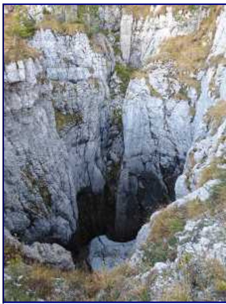
Névé au fond d'une tanne. Photo prise le 06/11/16.

Le passage par le Grand Montoir propose un tracé à flanc de falaise avec quelques passages délicats mais le sentier est équipé de mains courantes. Dénivelé de 660m, 4h Aller/Retour.