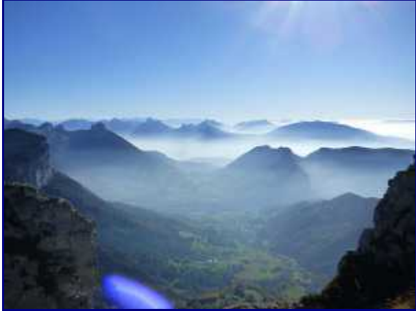
Du Parmelan, vue sur les vallées embrumées. Au bas, le hameau de la Blonnière.