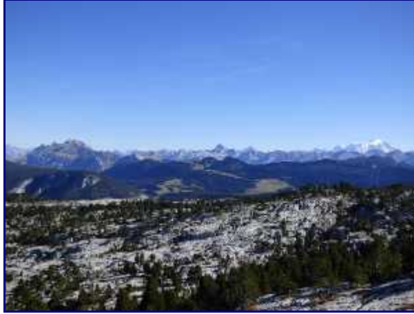
La partie sud du plateau du Parmelan. Et beaucoup plus de lapiaz.