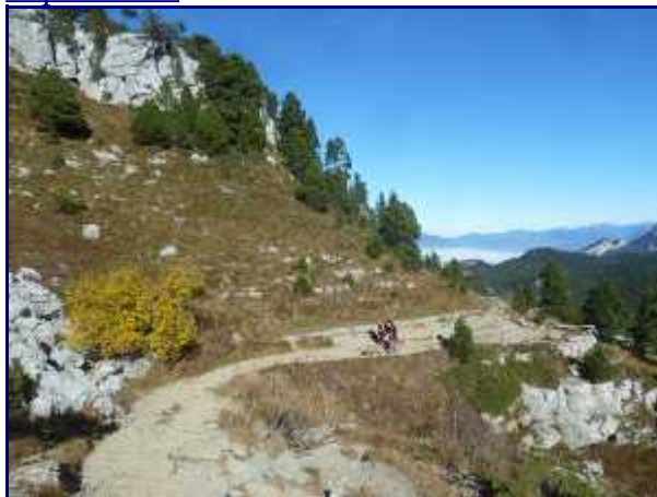
Chemin de montée. Au loin, la brume encore présente en vallée.

Tout au long du sentier, on découvre de plus en plus de lapiaz au fur et à mesure de la montée.