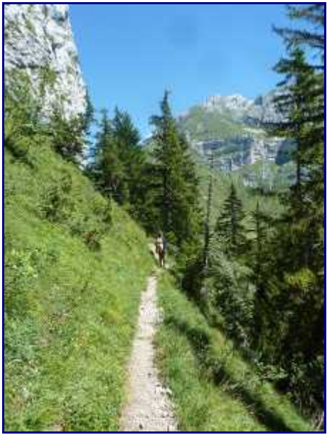
Sentier vers le col de l'Aulp.

On ne tarde pas à sortir du bois pour arriver au col de l'Aulp (1425m) et son alpage.