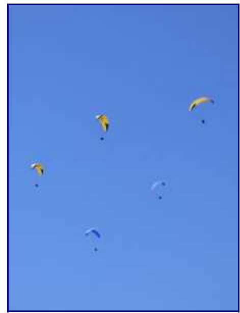
Concentration de parapentes...

Du col de l'Aulp, on peut monter à la Tournette. La vue sur le lac et les Aravis est splendide. Les Bauges et tous ces sommets sont juste en face.