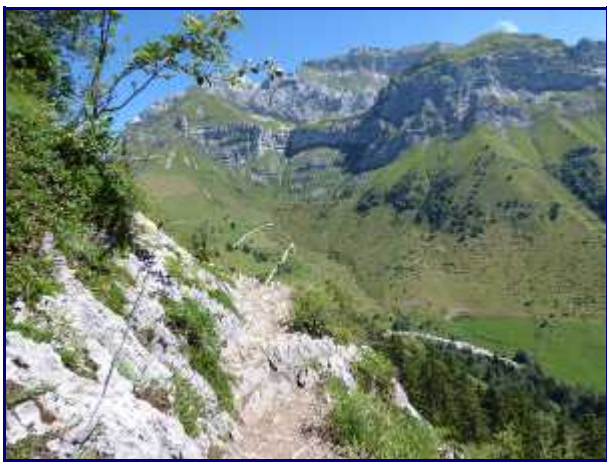
Du sentier, la tournette. En contrebas, le parking 'les Prés ronds' (1216m) et le chemin qui montent au col de l'Aulp.

En continuant, au collet des Charmes, à 200 mètres sur la gauche en aller-retour, le rocher de Roux (1500m) offre une vue panoramique sur le lac d'Annecy et les dents de Lanfon (1824m).