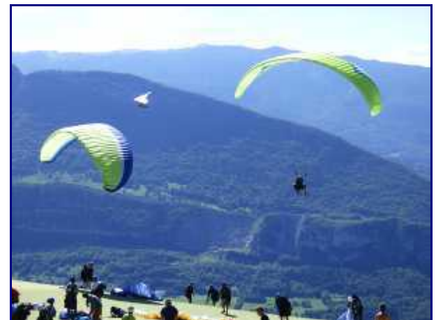
Décollage en parapente bi-place.

Fin août 2016, ont eu lieu les championnats du monde de parapente acrobatique. Yeah!