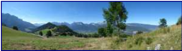
De la pointe de la Beccaz au Semnoz. Au premier plan, le col de la Forclaz.