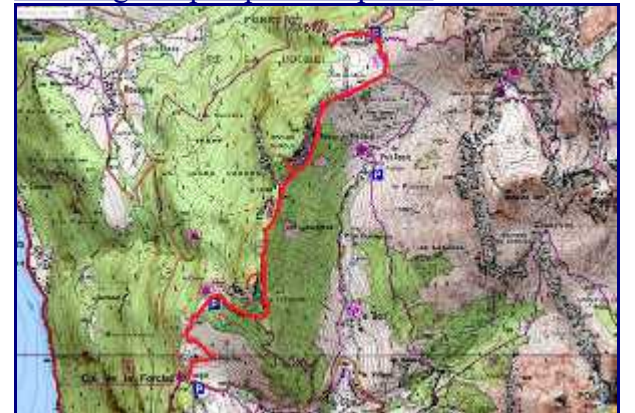
Plan du trajet du col de la Forclaz au chalet du col de l'Aulp.