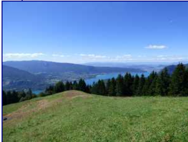
De l'alpage du col de l'Aulp, vue sur le lac d'Annecy.