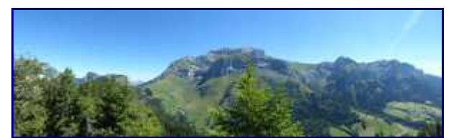
De la pointe de la Rochette (1491m), la Tournette (2351m) et la pointe de la Beccaz (2041m).

Le point de vue est remarquable sur tous les sommets des Bauges et la Tournette. Le lac, lui, est caché par la forêt.