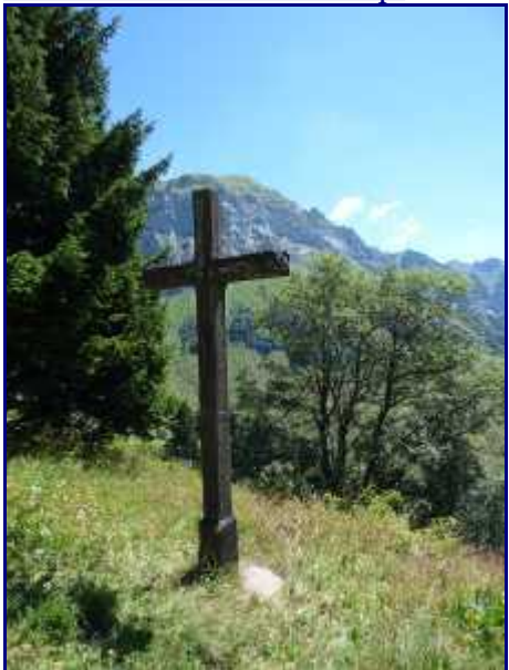
Croix dans l'alpage avant le col de l'Aulp.