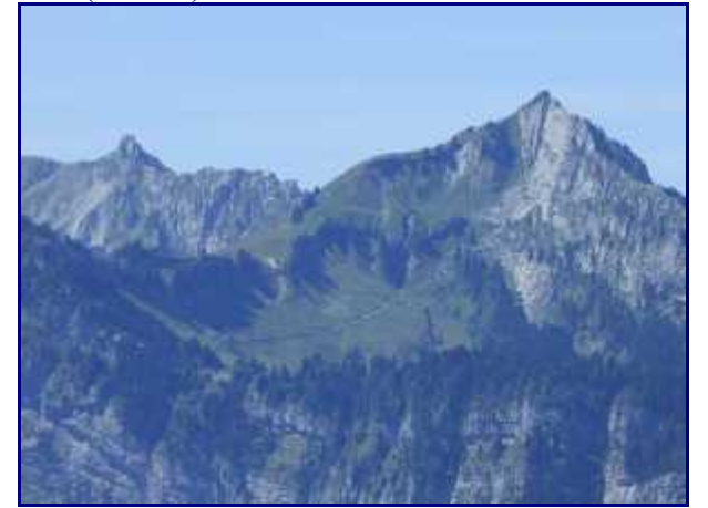
La dent des Portes (1932m) et Banc Plat (1907m).