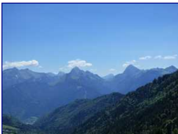
Les bauges depuis le col de l'Aulp. De la Sambuy, Arcalod, Trélod jusqu'à Banc Plat.

il est relié pour son approvisionnement par un câble au refuge du pré Vérel, au parking.