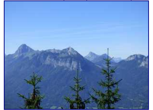
Le trélod, Banc Plat puis le Colombier (2045m) et Rossanaz (1891m). Devant, le Julioz (1673m) et le col de Bornette (1316m).

En passant au col de la Rochette, on peut (doit) rejoindre en 5 minutes en aller-retour la pointe de la Rochette (1491m), sur la crête.