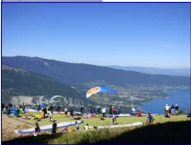
Aire de décollage des parapentes du col de la Forclaz.