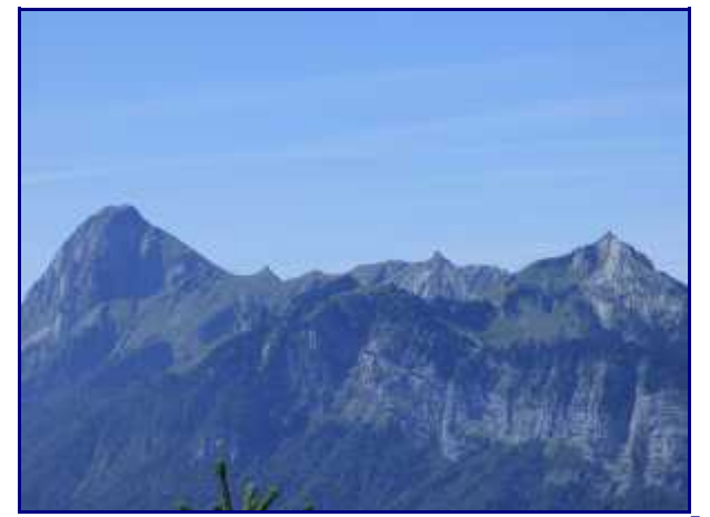
Le Trélod (2181m), le sommet de la dent de Pleuven (1771m), la dent des Portes (1932m) et Banc Plat (1907m).