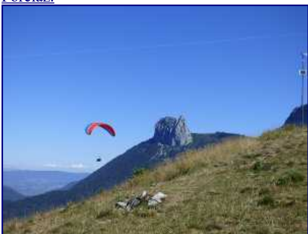
Décollage de parapente au col de la Forclaz. Au fond, les dents de Lanfon.