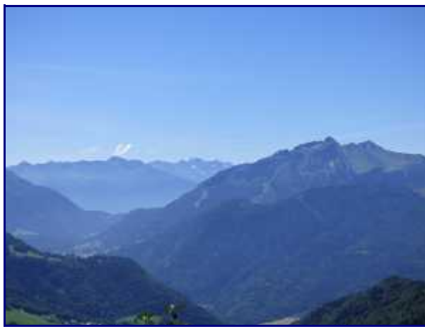
De la pointe de la Rochette (1491m), la Sambuy (2198m) et Chaurionde (2173m). A gauche, le col de Tamié (907m).

Du col de la Forclaz (1150m), prenez le chemin qui monte au nord, vers l'aire de décollage des parapentes et deltaplanes.