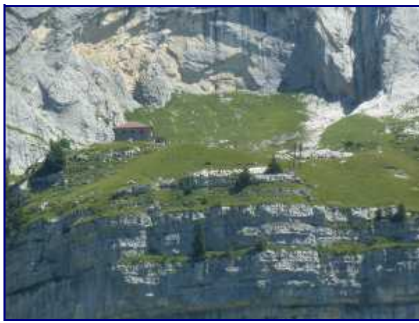
Refuge de la Tournette (1774m).