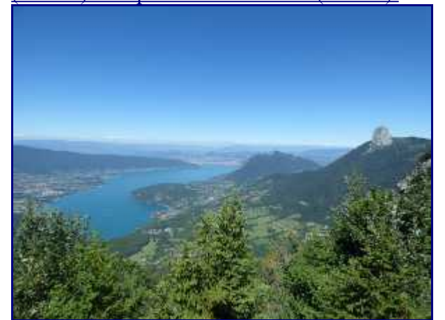
Du rocher du Roux, vue sur le lac d'Annecy, mont Veyrier/mont Baron et les dents de Lanfon (1824m).