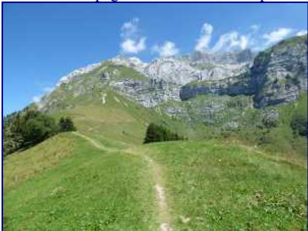
La Tournette (2351m).