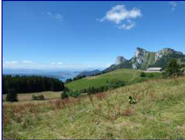
Lac d'Annecy, dents de Lanfon et le chalet du col de l'Aulp.