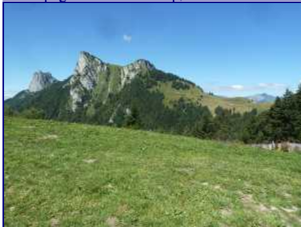
De l'alpage du col de l'Aulp, les dents de Lanfon (1824m), la roche Murráz (1768m) et le roc de Lanrenaz.

Le refuge de la Tournette (1774m) est installée en surplomb de la falaise.