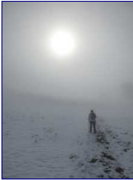
Brumes au Revard

Si l'on monte dans cette pente, on passe par les granges de la Plume pour arriver à la tourbière des Creusates.