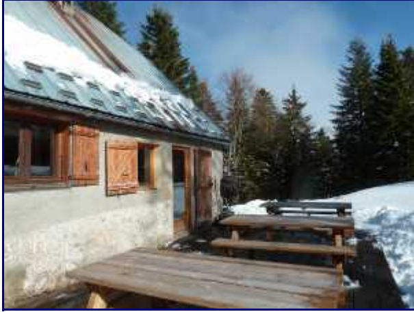
La terrasse du refuge de la Plate. Exposition sud-est.

Nous repartons tranquillement, les sapins déchargent le peu de neige de leurs branches.