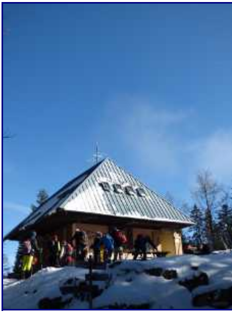
Le refuge de la Plate. Alt 1300 m.