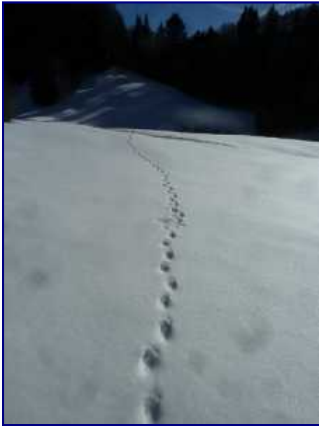
Traces dans la neige. Renard ?

Contrairement à ce matin, nous croisons une ou deux personnes. Mais c'est pas la cohue!