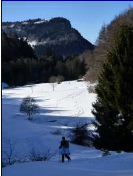
Descente vers le ruisseau des Otalets.