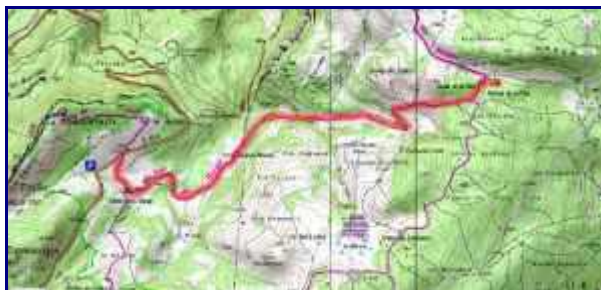
Plan simplifié de la balade. environ 200 m de dénivellé.

En bas de la carte, la zone naturelle protégée correspond à la tourbière des Creusates.