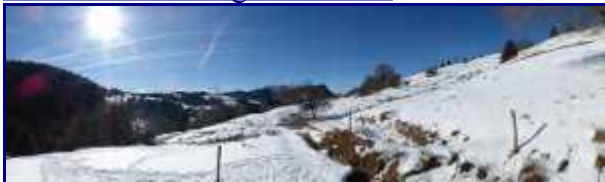
Sur le chemin du retour, Panorama au lieu-dit Otalets.