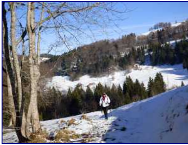
Au retour, dans la montée vers les chalets de la Clusaz, vue arrière sur le chalet Mermet.

A la sortie de la sapinière, au lieu dits Otalets ( en contrebas de la grange du même nom ), on voit bien sur l'autre versant, au sud-ouest, 3 chalets alignés dans la prairie.