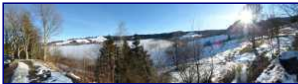
De retour au parking, vue sur la brume qui remonte de la vallée.

Mais ce jour là, on avait fait quand même une belle balade.