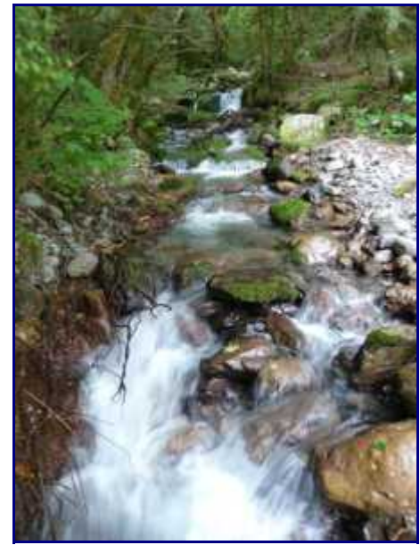
Le torrent de Bellevaux, en amont de la chapelle.

De la pépinière, on descend à travers la forêt dense jusqu'au Chéran que l'on suit jusqu'au parking de départ.