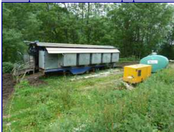
La salle de traite mobile à Bellevaux, avec le groupe électrogène et le tonneau à eau ('abreuvoir pour les vaches').