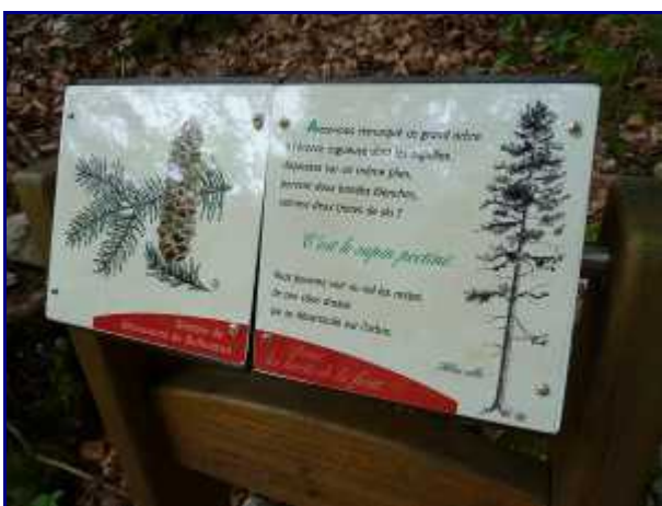
Exemple de panneau explicatif installé le long du sentier découverte.

Du parking, continuez à pied la route sur environ 500 m puis prenez le sentier qui monte sur la droite en lacets réguliers dans la forêt.