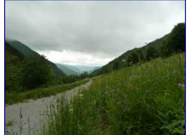
Dans le rétro, la vallée des Bauges devant.

Un troupeau de vaches laitières passe l'été à Bellevaux où elles sont traitées matin et soir sur place.