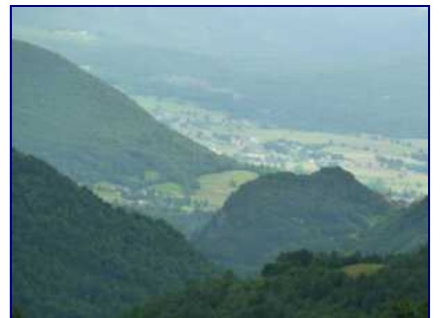
Zoom sur le verrou glacière du Chatelard, du temps des glaciations. A droite, l'église du Chatelard.

L'alpage est d'altitude assez faible comparativement aux autres. De plus, l'absence de chalet et le bon chemin d'accès fait que l'alpagiste ne reste sur place la nuit.