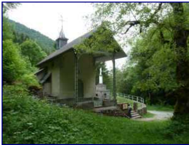
La chapelle de Bellevaux.

Sur cet emplacement, l'ancien prieuré avait été construit. En 1792, ces biens seront aliénés par les révolutionnaires puis il sera détruit en 1825 par un incendie et ces ruines utilisées comme carrière à pierre. Le seul vestige actuel est un monument érigé en 1955.