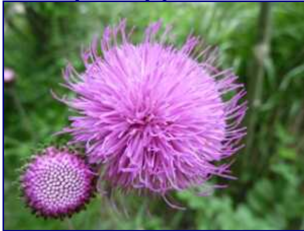
Cirse, dans les prés de Bellevaux.