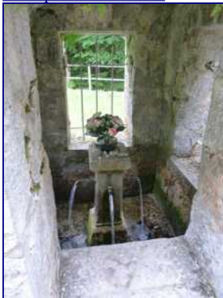
l'intérieur de la fontaine de la chapelle de Bellevaux.