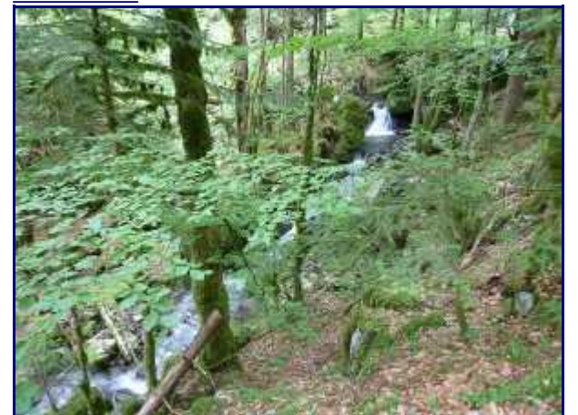
Le torrent de Bellevaux avant sa jonction avec le Chéran.