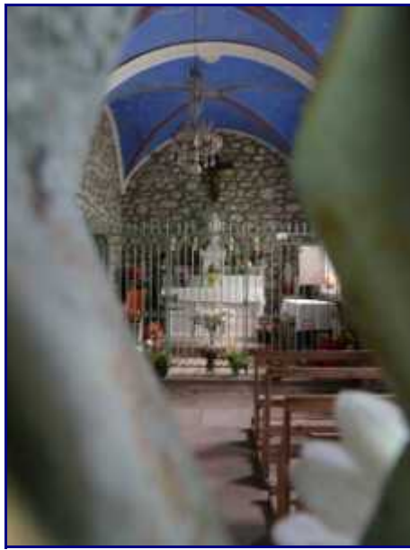
Détail de l'intérieur de la chapelle de Bellevaux.

Tous les ans, un pèlerinage a lieu le lundi de Pentecote.