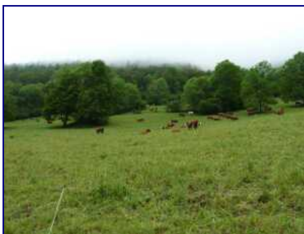
Le troupeau de vaches laitières qui pâturent l'alpage.

Et la qualité de l'herbe se répercute évidemment sur les fromages !