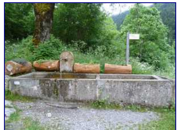
Le bassin de l'ancien village de Bellevaux, détruit par les allemands en 1944.

Cependant, ne l'ayant pas vu, nous avons traversé tout l'alpage jusqu'au pied d'Armène, en face. Bien nous en a pris, le paysage étant vraiment reposant et joli malgré le couvert nuageux de ce 23 juin 2013.