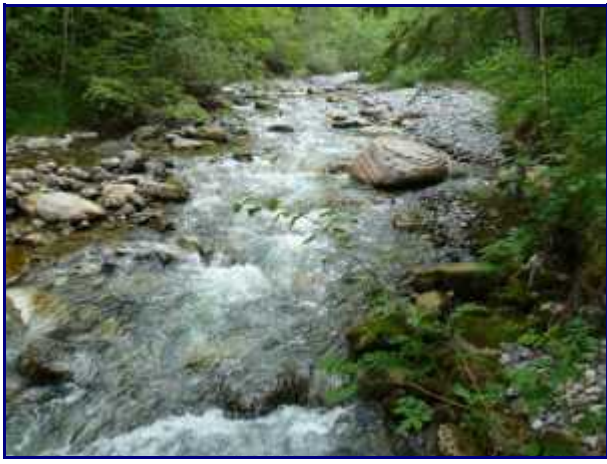
Le Chéran dans la vallée de Bellevaux.

Pour cette période de production, 1200 T de charbon était nécessaire soit l'équivalent de 15 000 m 3 de bois. On comprend ainsi mieux le déboisement intense de la Maurienne puis ensuite des Bauges.