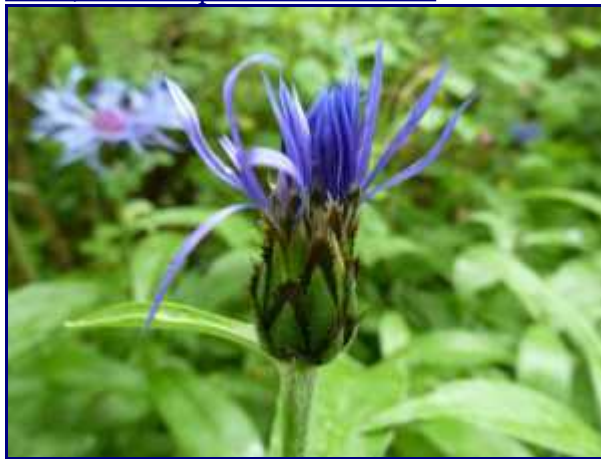
Bleuet, dans les prés de Bellevaux.

Vous rejoignez plus haut la route forestière qui dessert aussi l'alpage.