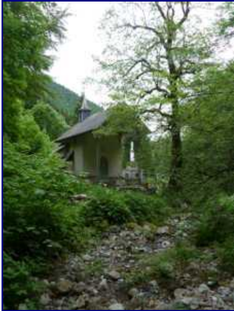
La chapelle de Bellevaux est en vue.

Du sommet de l'alpage, on peut aussi rejoindre l'Arcluse (2041m) en suivant le ruisseaux de la Lanche puis obliquer à droite et monter dans la pente.