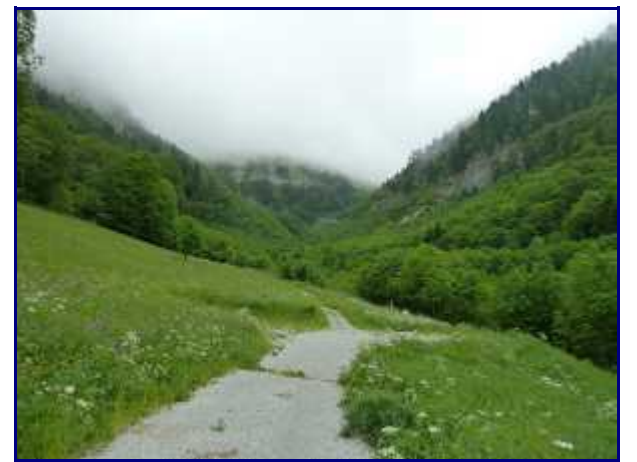
Arrivée au 'fond des prés', place de retournement au sommet de l'alpage.