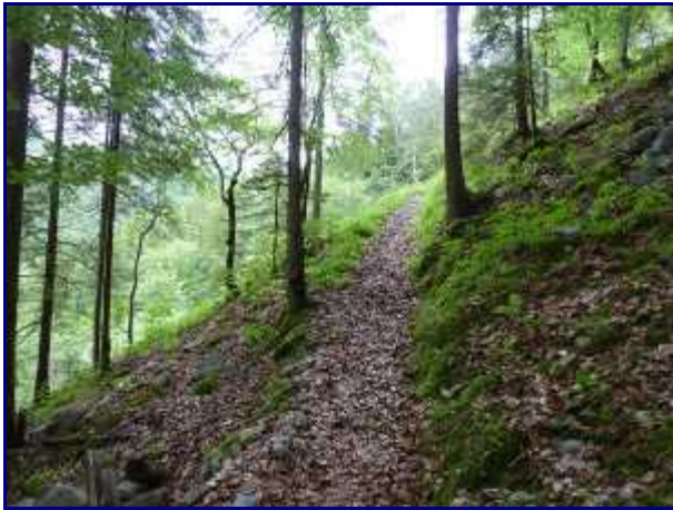
Le sentier qui monte dans les bois.

PS : Diaporama maxi-taille en cliquant sur les photos + roulette de la souris (ou flèches) pour le défilement.