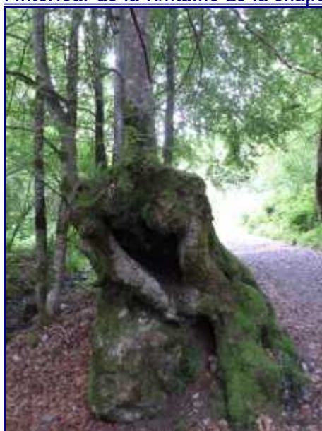
Fayard qui a poussé sur un rocher.