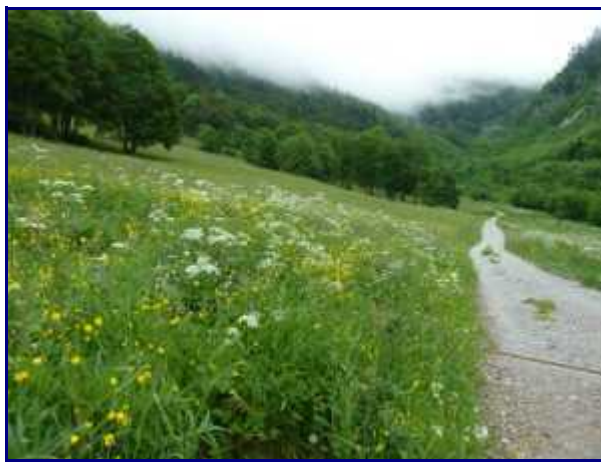
Arrivée au pied de l'alpage de Bellevaux.