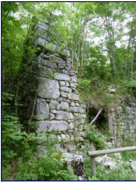
Ce qui reste de l'ancienne fruitière du village de Bellevaux.