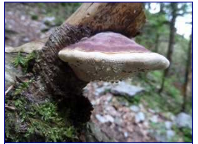
Rosée sur un champignon 'langue de boeuf'.

Dans le même secteur, vous pouvez aussi vous balader de Carlet à Bellevaux , c'est en sous bois.