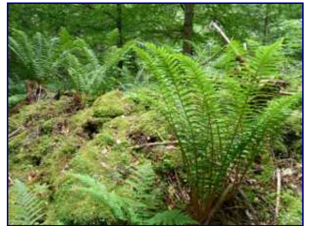
Fougères en quantité dans la forêt sous la chapelle de Bellevaux.

A son apogée, tous les 3 ou 6 ans, le fourneau était allumé pour une coulée de 6 mois produisant plus de 250 T de fer.