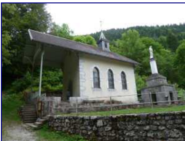
La chapelle de Bellevaux.

Cependant, le village comptait encore 40 personnes à la 2eme guerre.