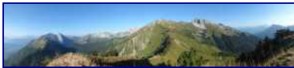
Du sommet du parc du Mouton (1859m).

Le chalet du Drison est à nos pieds. Le rejoindre via le col du même nom puis par une grande traversée relativement plate (point bas vers 1600m), on arrive au chalet de la Bouchasse (1705m).