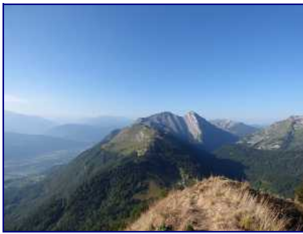
Dans le rétro. Orisan, Armenaz, Pécloz, Arclusaz. Au bas, le chalet du Haut du Four.

Par une succession de traversées et de lacets, on rejoint sans difficulté le chalet puis le col du Haut du Four (1518 m).