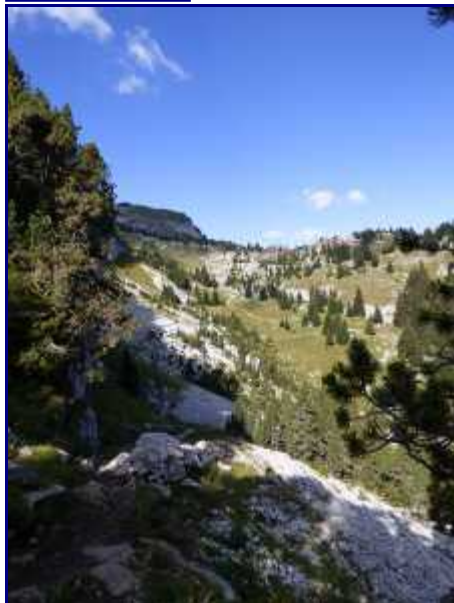
Le sentier des chèvres, au dessus du chalet de la