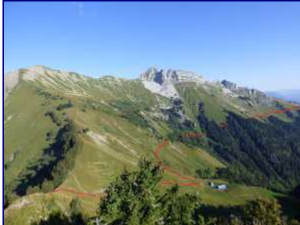
Pointes de Chaurionde et de la Sambuy. Sur la gauche, le col de Drison puis le chalet. Tout à droite, le chalet de la Bouchasse.