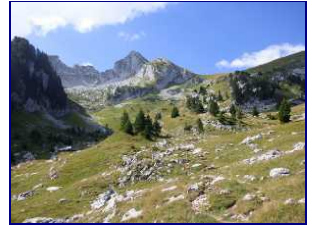
Combe de la Sambuy.

Le premier s'écarte d'un mètre, le 2eme vient me renifler puis s'en va.