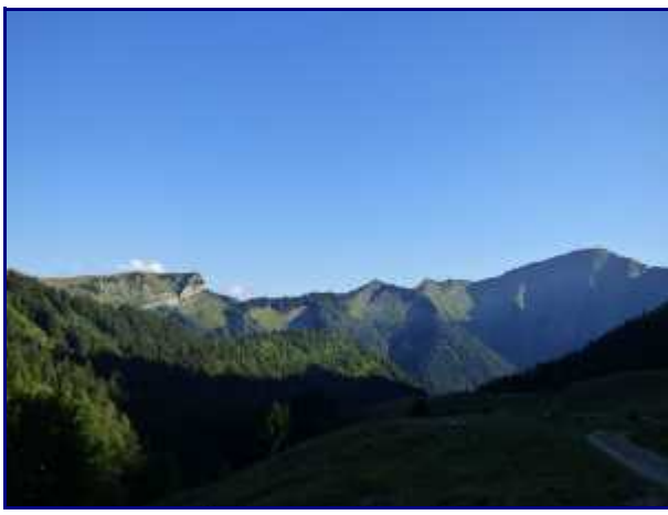
Soleil couchant sur le Grand Roc, pointe de la Fougère, de Chamossaran et Arménaz.

Le retour vers Nant fourchu se fait par Orgeval.