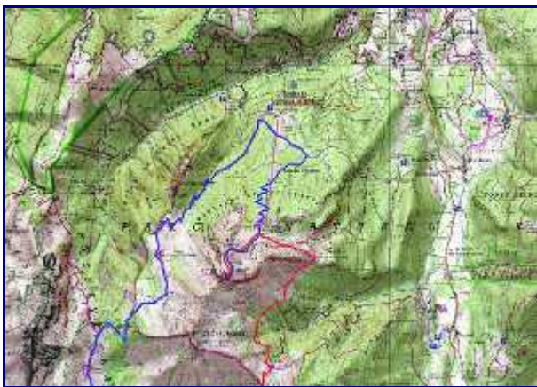
Partie nord du parcours. En rouge, pour monter à la Sambuy depuis Nant Fourchu et en bleu le retour par Orgeval.

Sur le bas de l'alpage, en face de nous, les rails du Pécloz sont bien visibles.