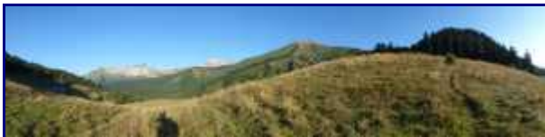
L'Encerclément, l'Arcalod, Chaurionde et le parc du Mouton, depuis le col du Haut du Four.

NB : Lien pour télécharger le topo de la rando à la Sambuy , avec départ de Nant-Fourchu, en Pdf.