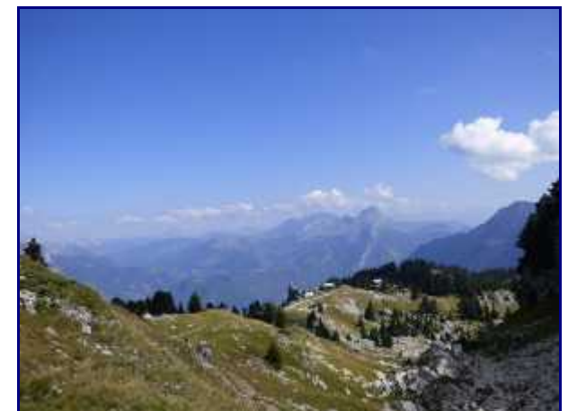
Vue arrière pendant la montée. Les Aravis puis la dent de Cons.

Au chalet de la Bouchasse, suivre le sentier des chèvres pour rejoindre le sommet de la station de Seythenex.