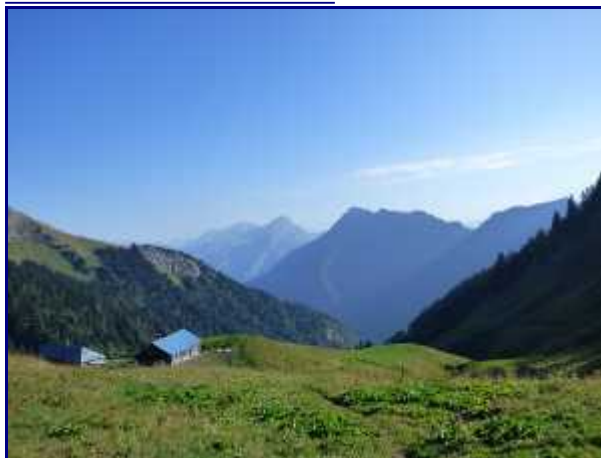
Le chalet du drison. Au centre, la dent de Cons puis la belle Etoile.