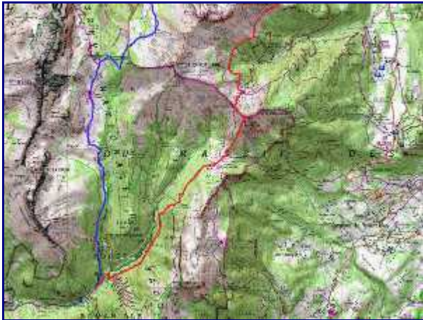
Partie sud du parcours. En rouge, pour monter à la Sambuy depuis Nant Fourchu et en bleu le retour par Orgeval.

Je n'avais pas trop le temps et je suis donc passer au plus court, par Orgeval.