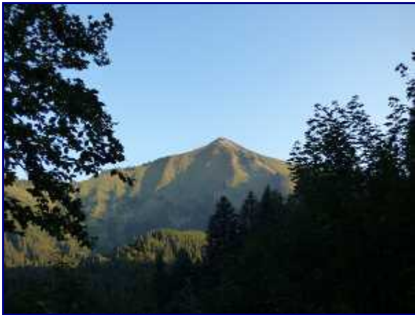
Chaurionde lors de la montée vers le col du Haut du Four.

PS : Diaporama maxi-taille en cliquant sur les photos + roulette de la souris (ou flèches) pour le défilement.