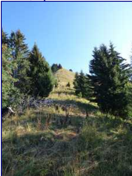
Crête de montée vers le Parc du Mouton.