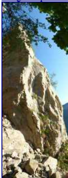
Au Tours Saint Jacques.

Les Tours St Jacques, au nombre de trois, se sont détachées de la falaise du Semnoz et glissent d'environ 2 cm par an.