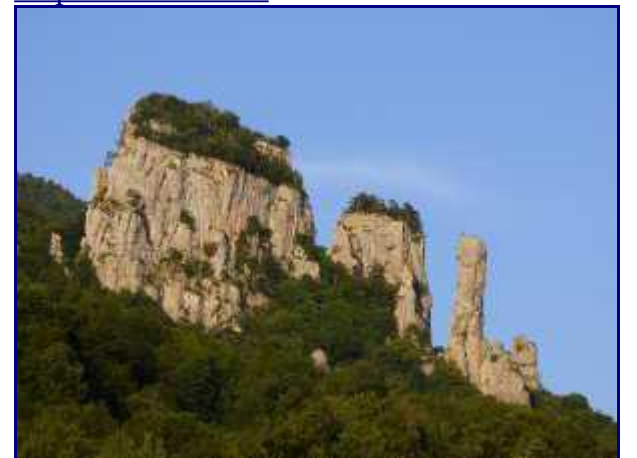
Les Tours Saint Jacques depuis le pont de l'Abîme.