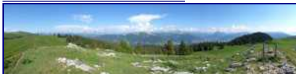
Panorama au Crêt de l'Aigle. Semnoz (1646m).

Vue arrière. Le chalet du Crêt de l'Aigle. Au loin, on devine le lac d'Aix les Bains.