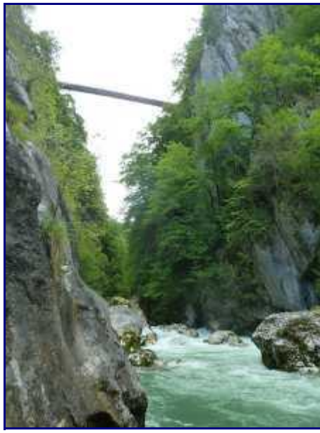
Depuis le 'chaos' du Chéran, le pont, 104 m plus haut.