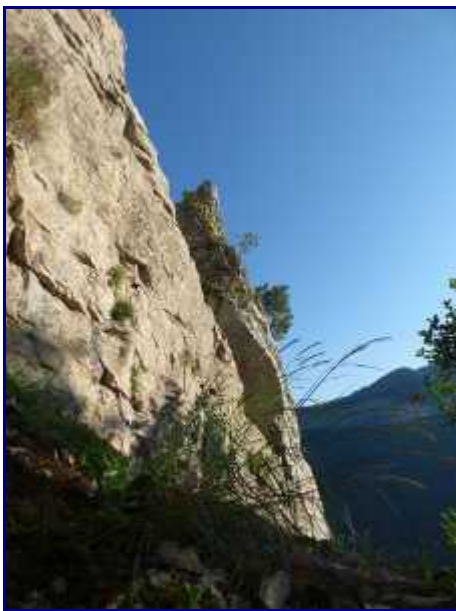
Les Tours Saint Jacques.

Au lieu-dit 'La Verrière' (830m), remonter sur la gauche au pied des Tours St Jacques (900m).