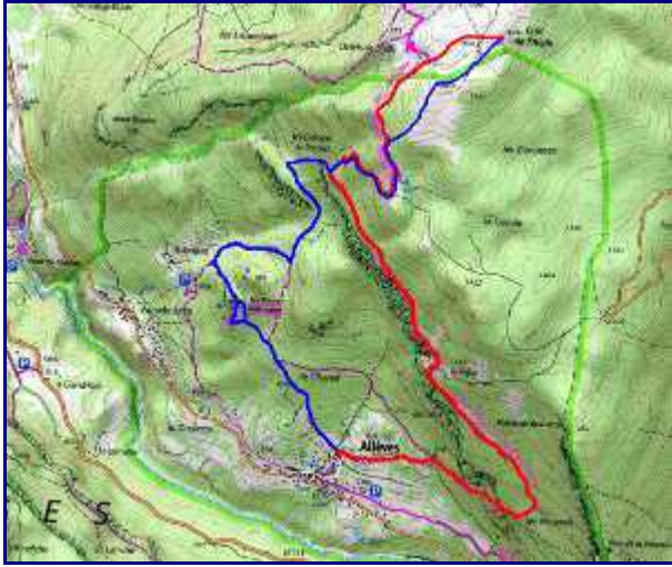
Plan de la rando au Semnoz depuis Allèves. En rouge, montée par la Figlia. En bleu, retour via les Tours Saint Jacques.

La descente vers Allèves se fait dans un chemin entre buis et pins, avec vue sur les Bauges.