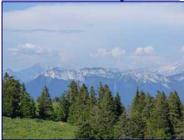
Les dents de Lanfon depuis le Semnoz.