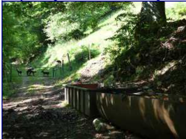
Une des barrières sur le chemin de la Figlia.