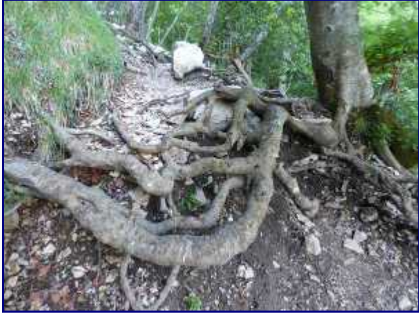
Racines au pied des Tours Saint Jacques.