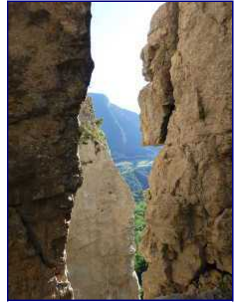
La 'Grand Raie'(lieu dit avant Cusy) depuis les Tours Saint Jacques.

Ce phénomène s'appelle un 'paquet glissé' (Une couche de marne sous-jacente joue le rôle de savon).