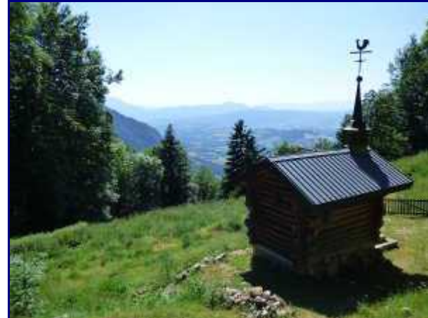
Petite chapelle sur le chemin du Semnoz.