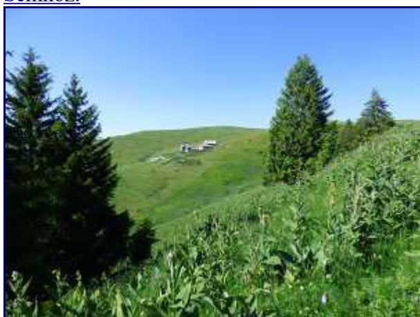
Le chalet de Gruffy, au Semnoz.

Vers 1400m environ, arrivée dans une grande clairière, il faut suivre le sentier à gauche jusqu'à l'alpage.