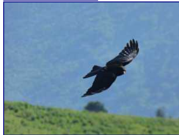
Le vol du choucas...