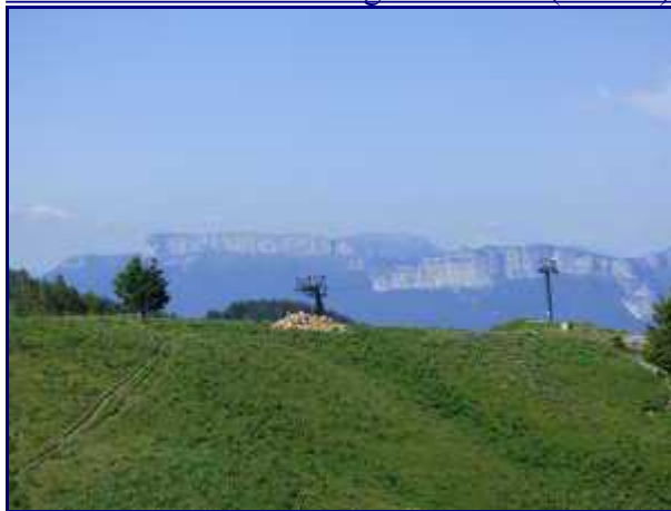
Le Parmelan. Le télésiège de l'aigle au Semnoz.