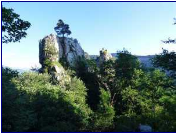
On approche des Tours Saint Jacques.