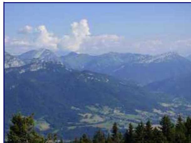
Le Pécloz, Pte des Arces, Pte des Arlicots et dent d'Arclusaz depuis le Semnoz.

On peut poursuivre en traversant le plateau jusqu'au point culminant, le Crêt de Chatillon.