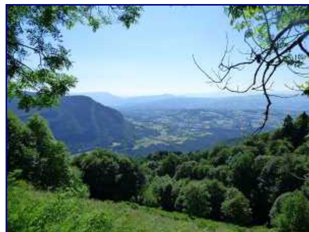
La vallée depuis 'le Perchet'.

Je referai cette balade à l'automne ou tôt au printemps pour avoir une meilleure vue sur les Tours St Jacques.