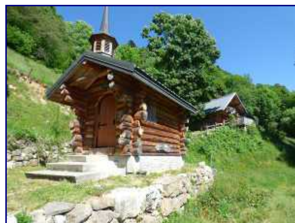
Petite chapelle sur le chemin du Semnoz.

Continuer sans complication le chemin, passer deux fois des portails animaliers et arriver vers 1250m à une petite chapelle et quelques chalets ( lieu dit 'la Prière'). Poursuivre la progression tout droit.