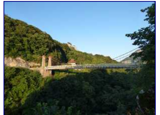
Le pont de l'Abîme.

Dans les éboulis, vous pouvez cependant faire le tour des 3 monolithes en faisant attention mais sans souci particulier.