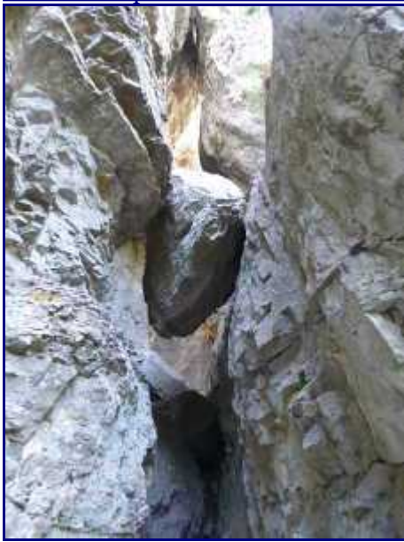
Bloc coincé au Tours Saint Jacques.

Si vous prenez tout droit, vous rejoindrez rapidement Allèves par le bois du Chenet.