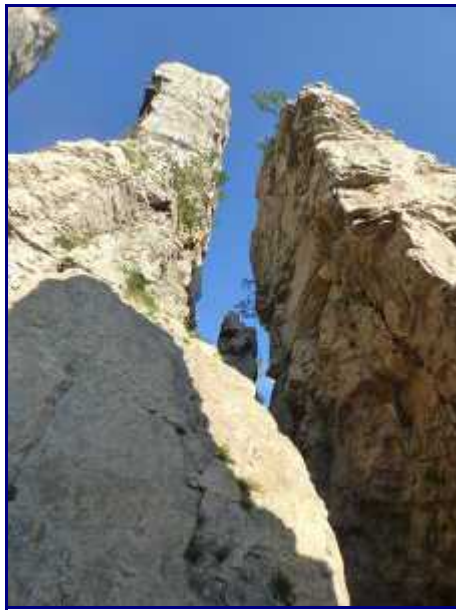
Les Tours Saint Jacques.