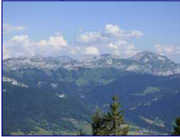
Arcalod et trélod depuis le Semnoz.