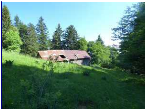
Chalet d'alpage avant ceux du Semnoz.

Au panneau 'Les granges du Perchet', prendre à droite un sentier qui monte d'abord raide puis qui s'oriente vers le sud-est en suivant beaucoup plus les courbes de niveau.