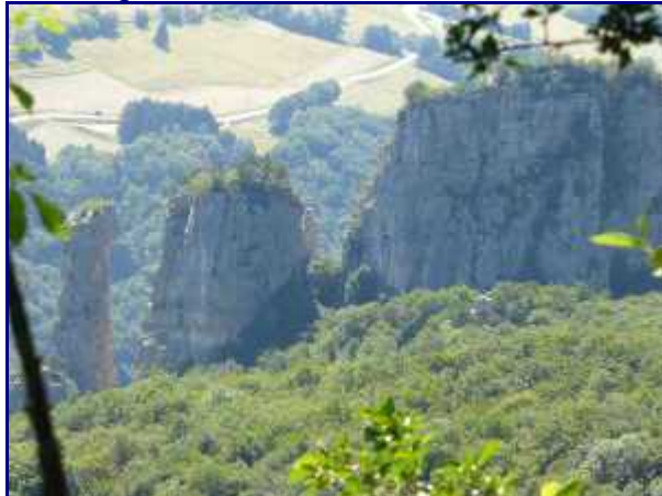
Vue sur les Tours St Jacques, depuis le chemin de la Figlia.

Du parking des cyclamens (640m), à proximité de l'église, monter dans le village (par la route à Boffe) puis prendre vers l'est le sentier qui récupère le chemin.