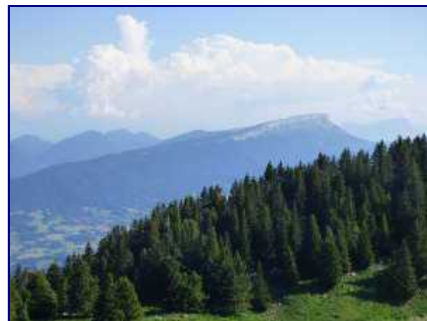
Margériaz depuis le Semnoz.

Prendre la descente sur votre droite qui contourne la falaise et qui arrive au panneau 'Le saut dessus' (990m).