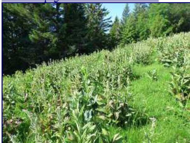
Champ de vératres avant d'arriver aux alpages du Semnoz.