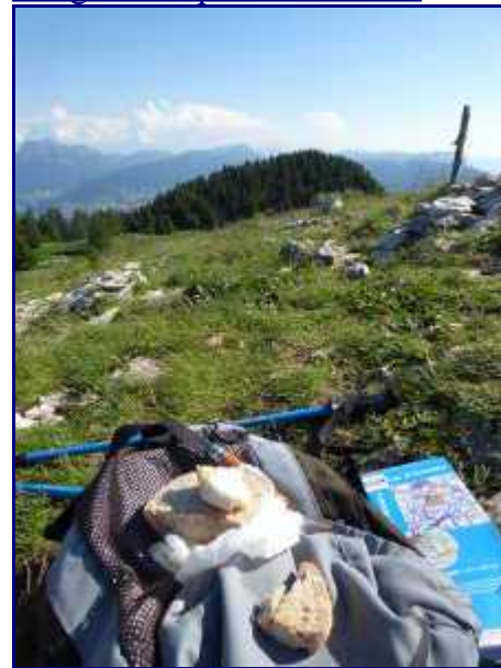
Casse-croute au Semnoz.