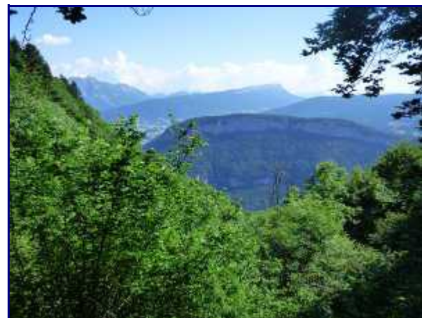
Dans le rétro, les Bauges depuis 'le Perchet'.

Ce chemin rectiligne et régulier amène à travers une forêt de fayards jusqu'aux chalets de la Figlia (1150m). Un petit refuge est mis gracieusement à la disposition des randonneurs.