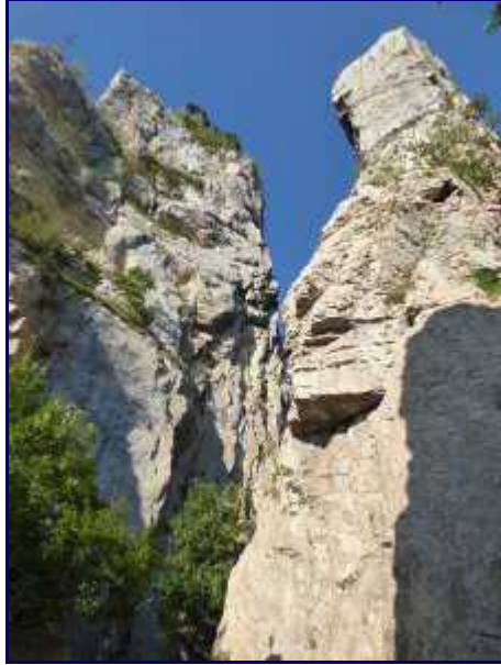
Les Tours Saint Jacques. Sous un autre angle.