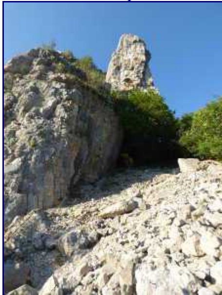
Eboulis sous les Tours Saint Jacques.