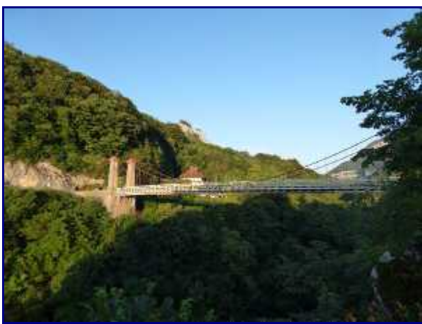
Le pont de l'Abîme, sur le Chéran entre Cusy et Gruffy.

PS : Diaporama maxi-taille en cliquant sur les photos + roulette de la souris (ou flèches) pour le défilement.