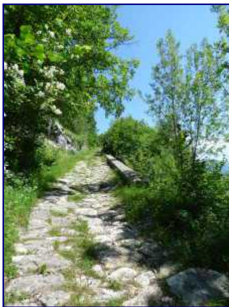
La voie pavée du XIX ème, au dessus d'Allèves.