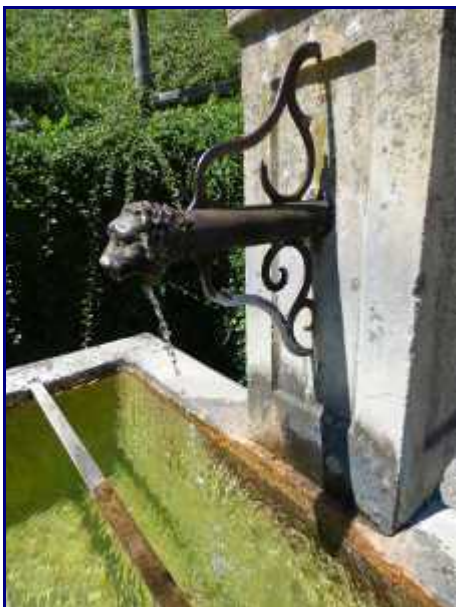
Goulot d'une des fontaines d'Allèves.

NB : Lien pour télécharger le topo de la rando au Semnoz , depuis Allèves, en Pdf.