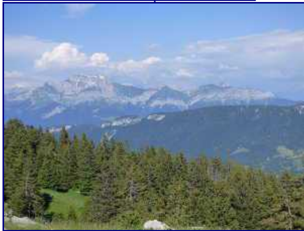
La Tournette depuis le Semnoz.