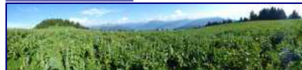
Champ de gentianes sur les hauteurs du Semnoz.