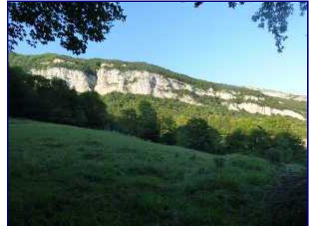
Les falaises de la Figlia, depuis Allèves.

La grosse tour culmine à 970 m d'altitude. La " fine " est une escalade très aérienne. Mais elles sont pourtant peu fréquentées car le rocher est de mauvaise qualité.