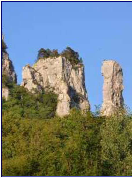
Les Tours Saint Jacques depuis le pont de l'Abîme. La 'Fine', à droite.