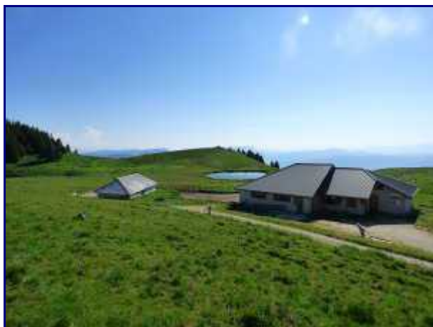
Le chalet du Crêt de l'Aigle, au Semnoz.

On passe à côté d'un chalet abandonné avec déjà quelques tôles du toit manquantes. Une tempête et s'en sera fini !