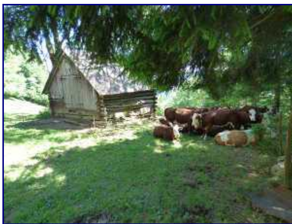
Troupeau de génisses au chalet de la Figlia.

On progresse sur le GR du Tour des Bauges.