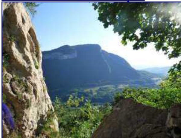
Banges depuis les Tours Saint Jacques.