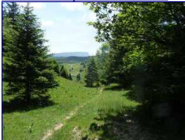
Descente du Crêt de la Dolca. Falaise de Margéraz au loin.