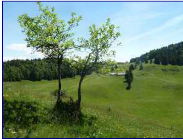
Dernier regard dans le rétro sur le Creux de Lachat...

Du panneau, prendre sur votre droite, en direction du chalet du Trouset.