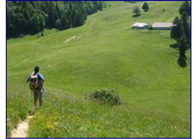
Alpage du Creux de Lachat.

De la Dolca (point coté 1434m sur la carte IGN mais nom pas marqué), on domine l'alpage du creux de Lachat et le refuge un peu caché par les arbres, en lisière de forêt.