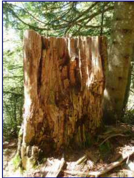
Souche en décomposition.