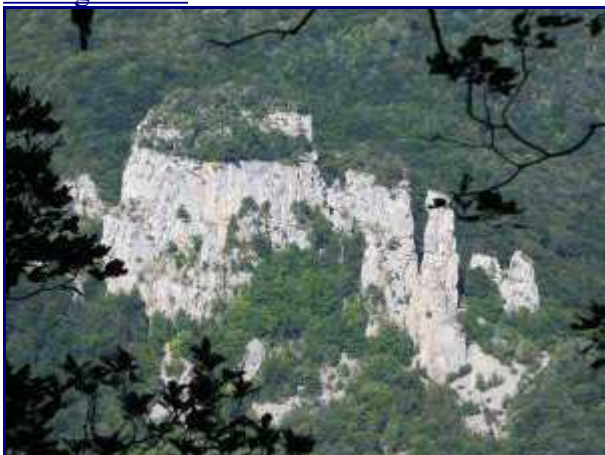
Vue arrière. Les Tours Saint Jacques, au dessus d'Allèves.