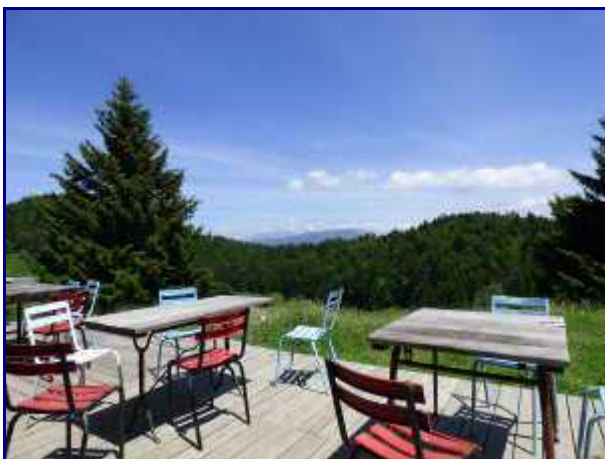
Refuge du Creux de Lachat. La terrasse.

Le retour se fait en aller-retour jusqu'aux 'Trois Bornes'.