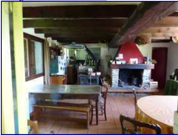
Refuge du Creux de Lachat. L'intérieur.

Le refuge du creux de Lachat est un peu plus haut que le chalet d'alpage.