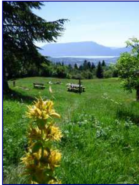
Le chalet du Trouset. Le lac d'Aix les Bains.

La vue sur le lac du Bourget est vraiment jolie et les alentours sont bien entretenus.