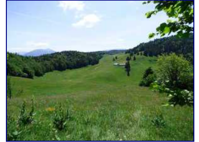
Alpage du Creux de Lachat.