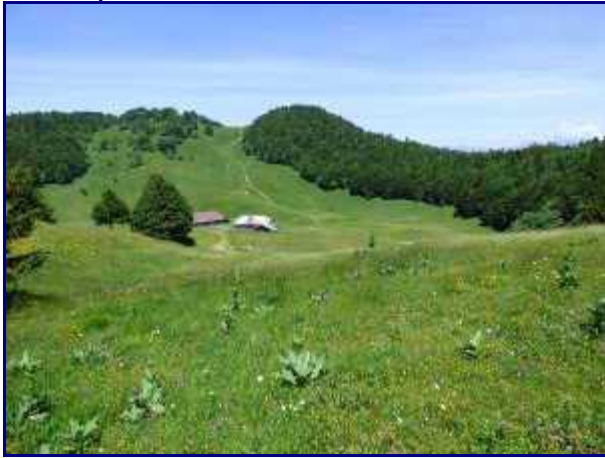
Dans le rétro. Du refuge du Creux de Lachat, le chalet d'alpage.