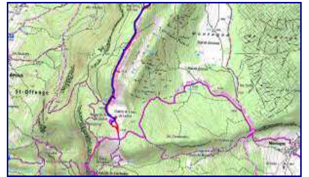
Plan de la rando au Creux du Lachat depuis Cusy. En rouge, montée par la Revêche. En bleu, retour par le chalet du Trouset. Partie sud.

On peut aussi atteindre le creux de Lachat en départ d'Arith (Montagny).