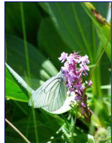
Papillon sur une orchidée. Alpage du Creux de Lachat.

De la Dolca (point coté 1434m sur la carte IGN mais nom pas marqué), on domine l'alpage du creux de Lachat et le refuge un peu caché par les arbres, en lisière de forêt.