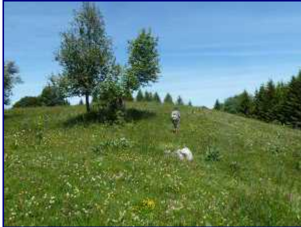
Montée au Crêt de la Dolca

Suivre sans difficulté le sentier qui franchit les barres rocheuses qui ceinturent le versant nord de la montagne de Banges. Quelques passages sont câblés ou équipés de marches.