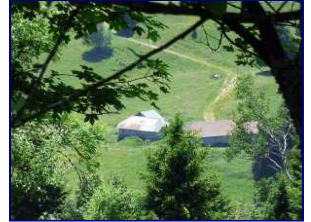
Chalet d'alpage du Creux de Lachat.

De celui de la Dolca, monter en 5 minutes sur la butte, sur votre gauche, pour profiter de la vue.