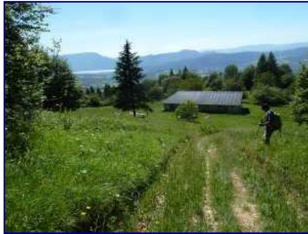
Le chalet du Trouset.