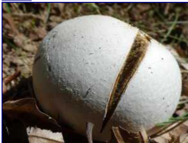
Vespe-de-loup juste avant 'l'explosion'. On devine les