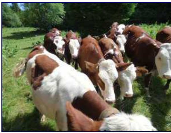
Troupeau de Génisses avant le Creux de Lachat.

Du parking, prendre le sentier puis de suite à gauche en direction de la Revêche et les Trois Bornes (puis le Crêt de la Dolca et le Creux de Lachat). Ce sont 4 lieux que l'on va successivement atteindre.