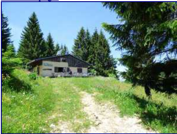
Refuge du Creux de Lachat.