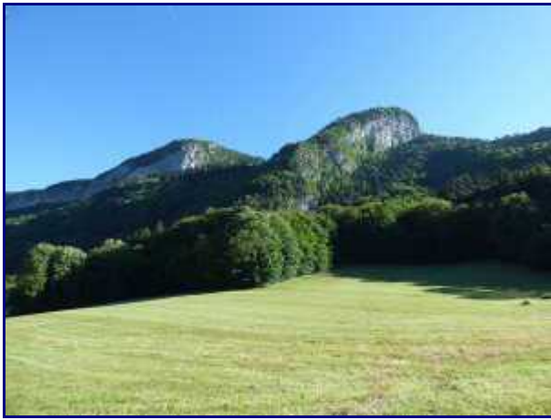
Le sentier monte à gauche de la barre rocheuses (les Rogneuses) et redescends sur la droite.

PS : Diaporama maxi-taille en cliquant sur les photos + roulette de la souris (ou flèches) pour le défilement.