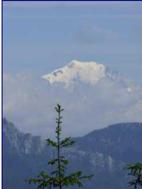
Le Mont Blanc depuis le Crêt de la Dolca.