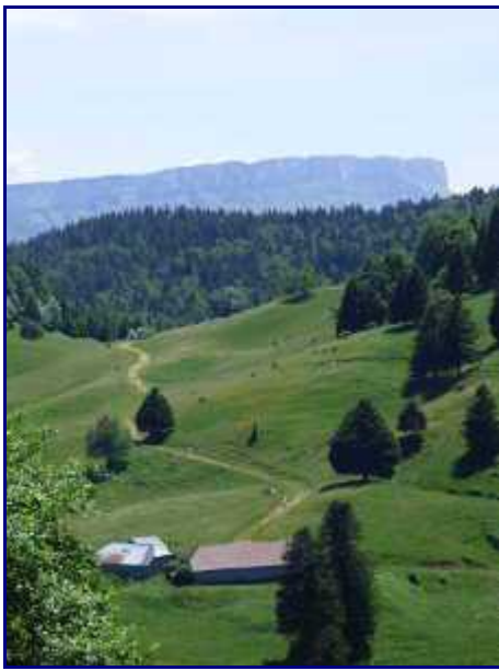
Alpage et chalet du Creux de Lachat. Margériaz en arrière-plan.