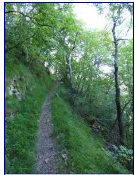
Sentier très agréable de descente vers la Grand Raie.

La descente jusqu'au parking de la Grand-Raie est agréable.