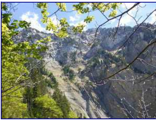
Les ravins de la Lavanche, sous la croix de Rossanaz.