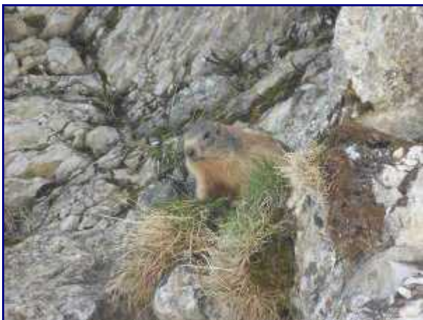
Marmotte à Rossanaz. Sur l'autre versant.

Vous pouvez consulter ma page sur le stade de neige de Margériaz pour l'hiver. En été, la Spéleo-rando de Margériaz est vraiment super.