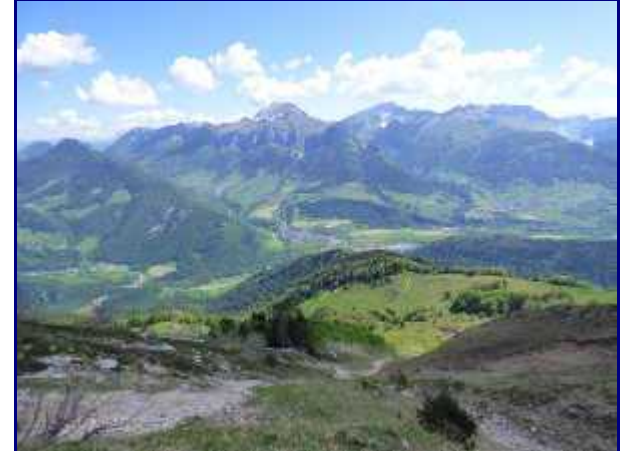
Dans les pentes surplombants l'alpage.

De la croix du Plane, j'ai choisi de continuer dans la même direction pour rejoindre le réservoir d'eau. Il sert à alimenter plusieurs bassins avec des flotteurs automatiques pour le bétail qui pâture la montagne.