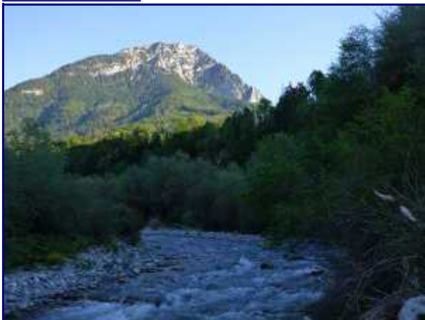
Rossane depuis la passerelle, sur le Chéran.

Pour info, tous les ans (depuis 1944), une messe est dite à Rossane le dernier dimanche de juillet.