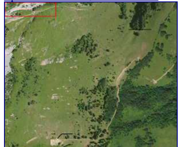
Vue aérienne du secteur. Il faut passer au centre du rectangle rouge. Zoom à la vue suivante.

Du réservoir, j'ai pris à flan de montagne vers l'ouest