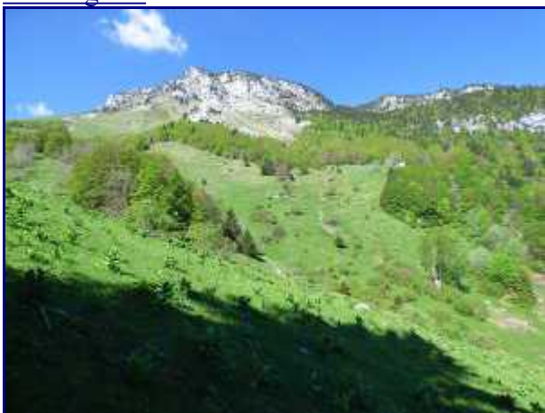
Arrivée au pied de l'alpage de "la montagne à Besson".