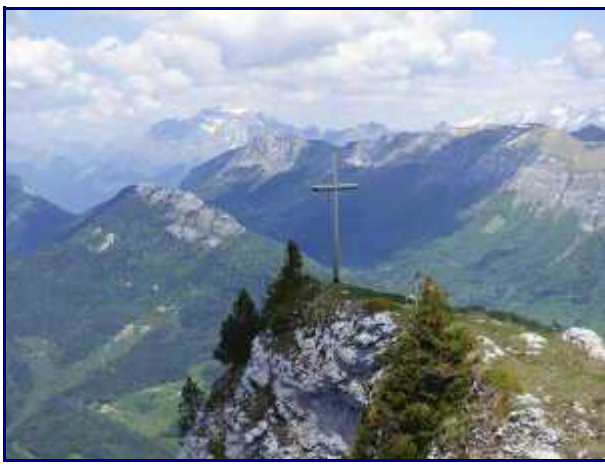
De la table d'orientation, la croix de Rossane.