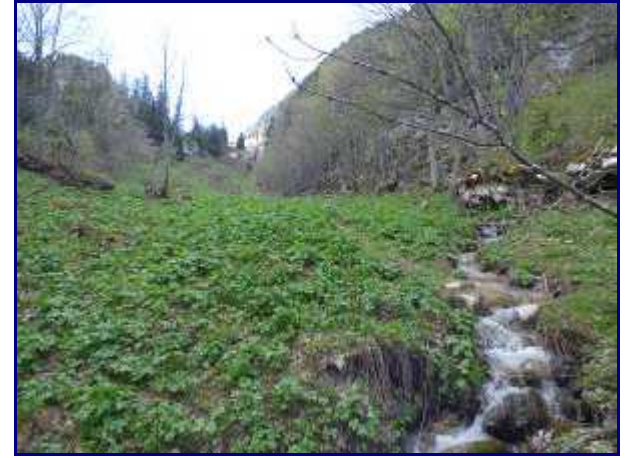
Dans le rétro. Sur le bas de la combe de l'Illiette.

NB : La fin de la piste forestière a été réalisée en été 2015. Auparavant, elle s'arrêtait un peu après le départ pour l'alpage des chalets Besson et Chaffard.