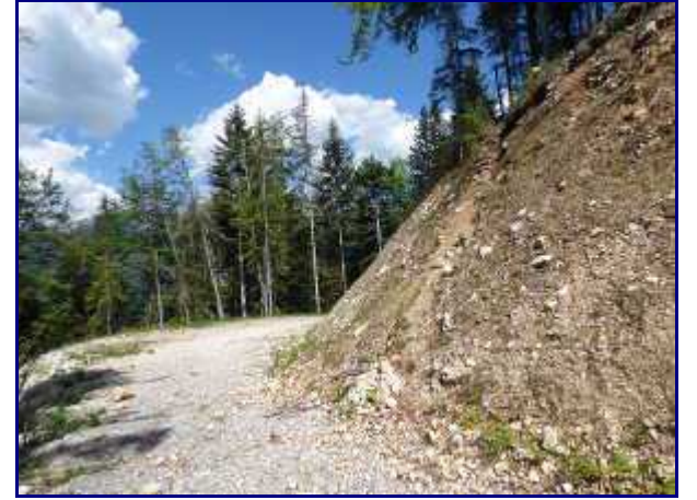
Arrivée du sentier (à droite) sur la piste forestière de Montlardier.