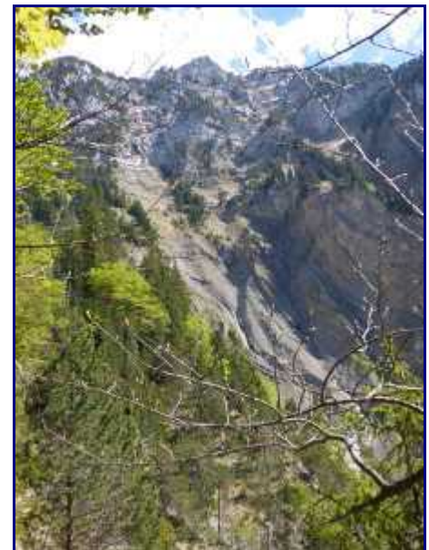
Les ravins de la Lavanche, sous la croix de Rossanaz.

La vue sur les ravins de la Lavanche est assez spectaculaire. Il faudra que j'y retourne plus longuement.