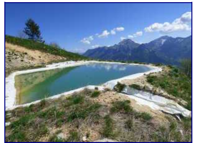
Réservoir d'eau pour le bétail de la montagne à Besson.