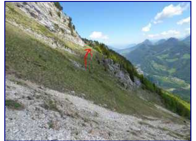
Dans le pierrier sous le roc de Poyez.

Pour info, le troupeau de génisses emmontagne vers la mi-juin chaque année. En 2019, c'était le 15 juin.