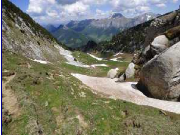
Encore quelques névés sur le haut de la combe de l'Illiette. Début juin 2019.