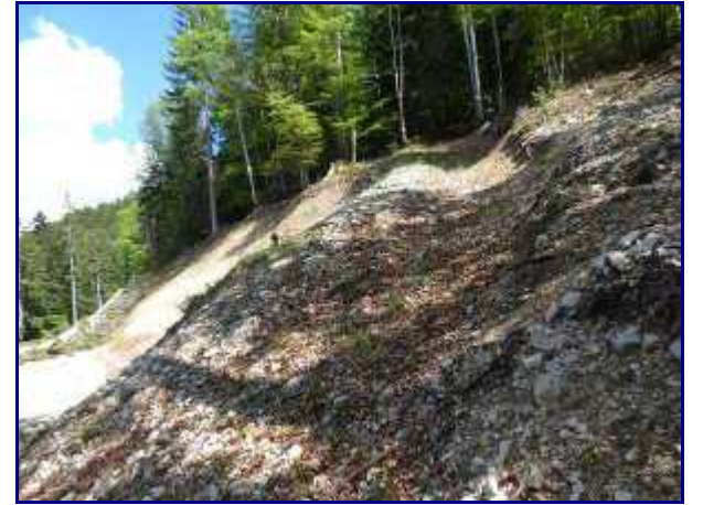
Départ vers les ravins de la Lavanche.

Par curiosité, j'ai décidé de suivre la piste jusqu'au bout (en jaune sur le plan) et ensuite de monter en direction de la croix de Rossane par une ancienne piste de débardage qui finit par se perdre.