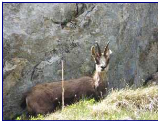
Chamois sous les rochers. A Rossanaz, au dessus de nos gîtes.

Le retour sur nos gîtes se fera par la combe de l'Illiette puis le sentier qui descend directement sur 'Montlardier' par la Fraisse.