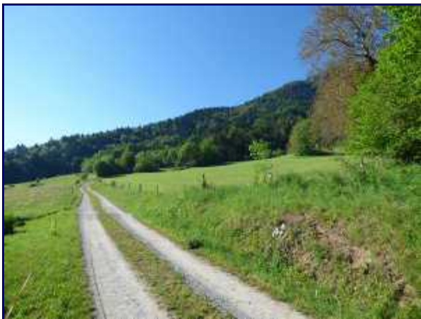
La piste forestière au départ de Montlardier, à 500 m de nos gites.

NB : Lien pour télécharger le topo de la rando pour Rossanaz , par la croix du Plane puis le 'trou du Pachu', en Pdf.