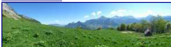
Panorama à la croix du Plane.