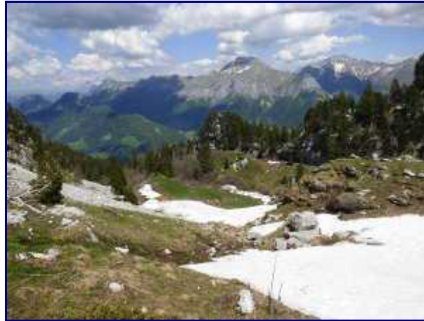
Plus bas, dans la combe de l'Illiette. En face, Trélod et Arcalod.

Au milieu de l'alpage, plusieurs marmottes sifflent à mon arrivée. Plus loin, un chamois siffle puis remonte doucement vers les pentes.