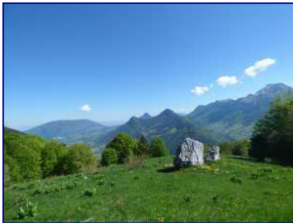
Les Bauges depuis la croix du Plane.

La piste est un peu défoncée actuellement par les tracteurs de débardage car une coupe de bois est en cours d'exploitation (juin 2019).