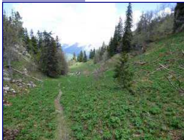
Sur le bas de la combe de l'Illiette.

Le bas de la combe se ressert de plus en plus. A partir de juillet, la végétation est 'exubérante' et assez haute. Après une averse, on est vite trempé. Ce n'est pas le cas en ce début de mois de juin.