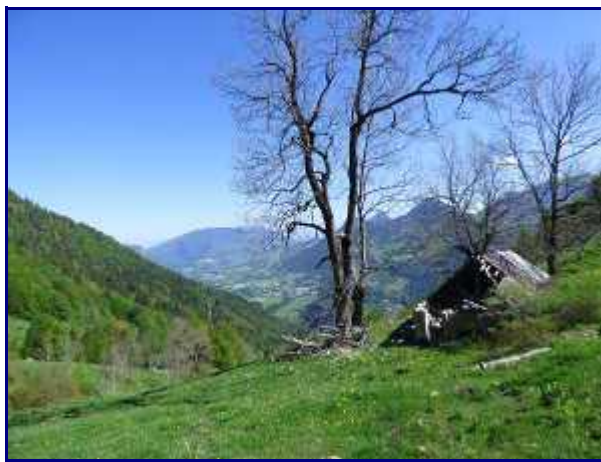
Le chalet Besson.