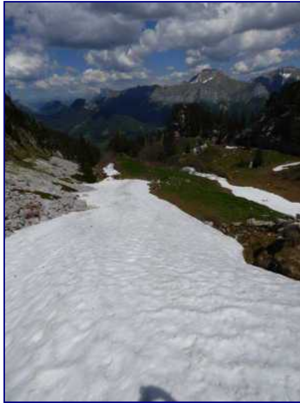
Descente sur le névé.