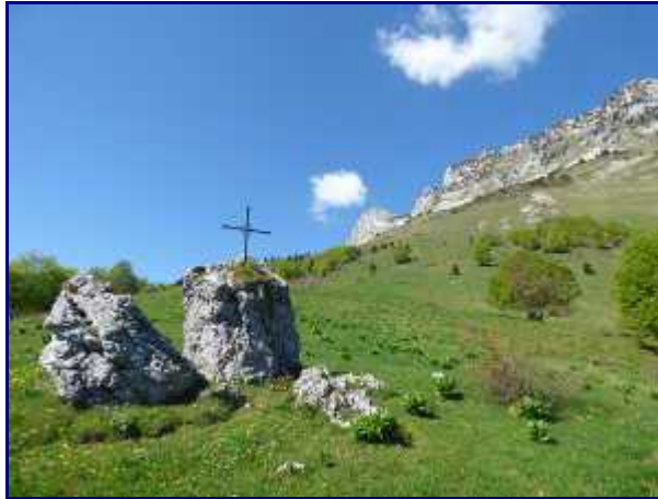
La croix du Plane.

Suivez la piste jusqu'à la barrière installée. La montée vers l'alpage de 'la montagne à Besson' part sur votre gauche.