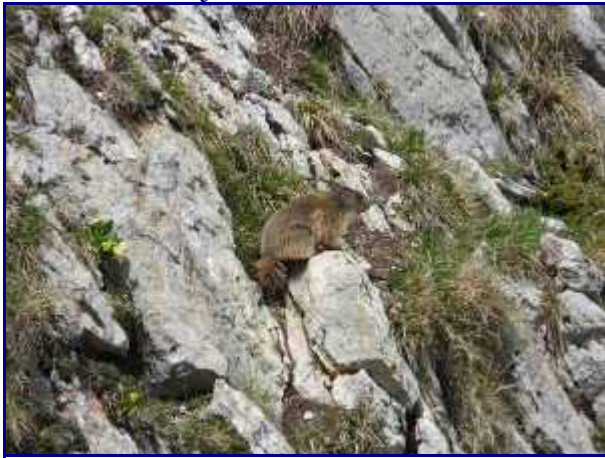
Marmotte à Rossanaz.

Depuis la croix de Rossane, on a une vue directe sur le stade de neige de Margériaz.