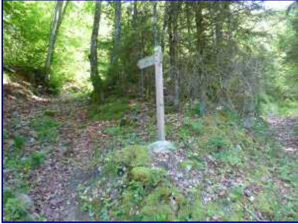
Bifurcation au dessus de Montlardier. Un panneau qui commence à dater !