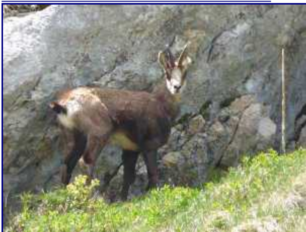
Chamois sous les rochers. A Rossanaz, au dessus de nos gîtes.