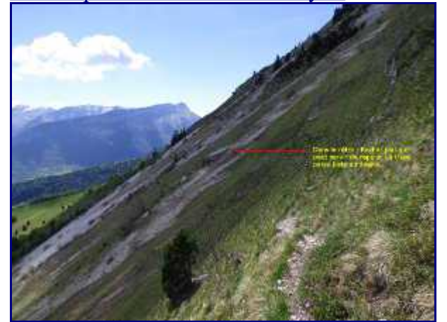
Dans le rétro. Le gros rocher plat dans les éboulis se repère assez facilement, et surtout de loin.