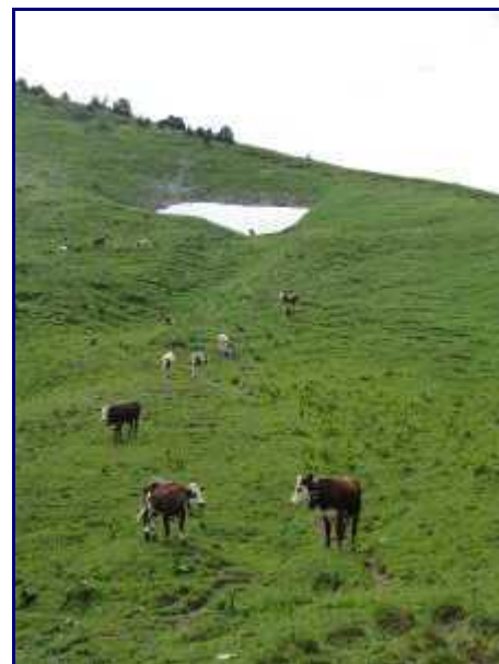
Dans le rétro, descente sous le col de Rossane.

Fabriquée à Arith, elle a été transportée par hélicoptère puis fixée sur sa base le 18/07/2013, avec prises de terre et cables d'haubanages.