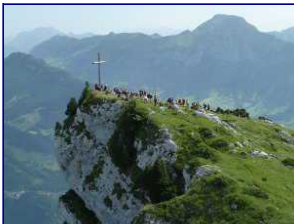
Depuis la table d'orientation, la croix de Rossanaz.