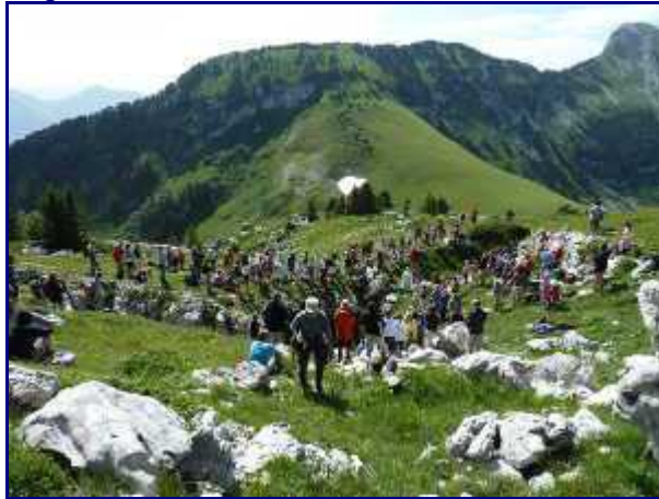
Le 28 juillet 2013, messe à Rossanaz.

Tous les ans depuis 1944, une messe est dite à Rossane le dernier dimanche de juillet.