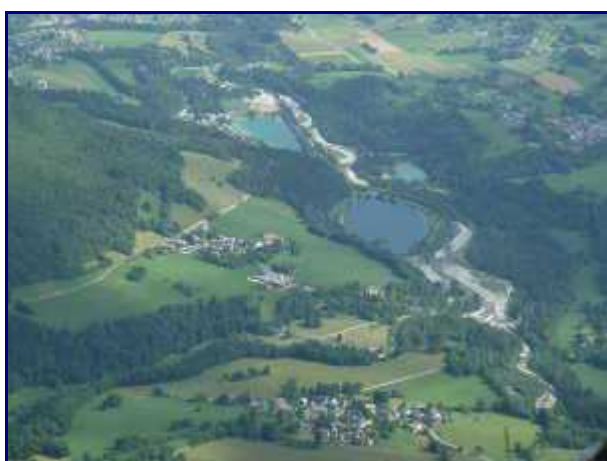
Les 4 plans d'eau du Chéran. Le plus grand du Chatelard, puis celui de la Motte (sur l'autre rive), le 1er de Lescheraines et tout en haut, celui de baignade, toujours sur Lescheraines.

Quelques centaines de mètres plus loin, coté sud, une table d'orientation a été installée il y a quelques années.