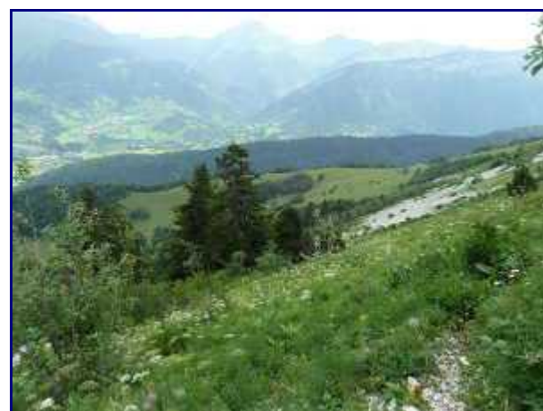
Descente vers l'alpage de la 'montagne à Besson'. En face, le Pécloz.

Un petit passage permet de franchir sans difficulté une barre rocheuse pour se retrouver au sommet de l'alpage voisin.