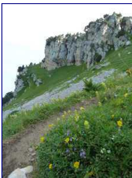
Vers le haut de la combe du cheval.

Au sommet de la combe du Cheval (1700m), prendre à droite, le col du Colombier puis le Colombier.