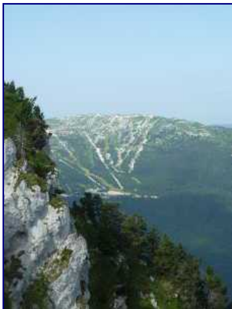
Margérianz depuis la croix de Rossane.

Vous pouvez consulter ma page sur le stade de neige de Margérianz pour l'hiver. En été, la Spéleo-rando de Margérianz est une découverte passionnante du sous sol karstique.