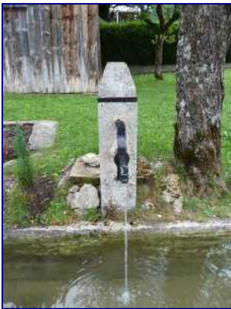
Le bassin au départ d'Aillon-le-Vieux.

PS : Diaporama maxi-taille en cliquant sur les photos + roulette de la souris (ou flèches) pour le défilement.