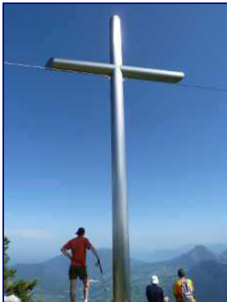
Je fais 8 m de haut, 4 m de large, toute en inox (3 mm) pour un poids total de 350 kg. je suis, je suis ... la nouvelle croix de Rossane !

En effet, plus de 150 personnes étaient présentes à 11 H en ce dimanche 28 juillet, soit environ 3 fois plus que les années précédentes !