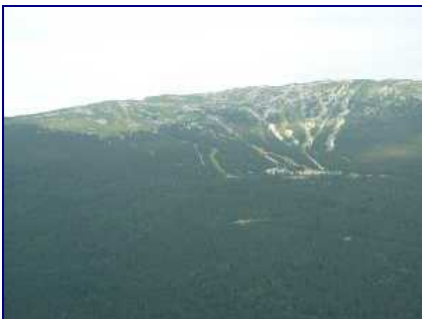
Dans le rétro, le stade de neige de Margériaz.

NB : Lien pour télécharger le topo de la rando pour Rossanaz & Colombier , par Aillon-le-Vieux, en Pdf.