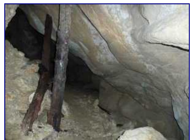
Intérieur de la grotte du Mineur.

A mi-chemin, sur le petit surplomb rocheux, un sentier non balisé part à flanc de montagne sous le Colombier. C'est celui que je prends quand je redescends sur Rossane.