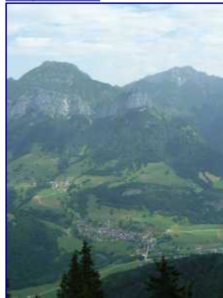
La Compote (en bas) et Doucy, sous le Trélod et la dent de Pleuven.