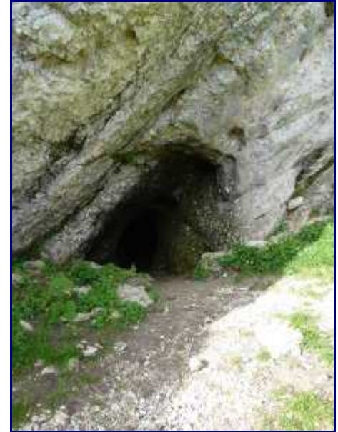
Entrée naturelle de la grotte du Mineur.

Sous le col du Colombier, dans le pied du banc de rocher, se trouve une grotte qui a été creusée par l'homme : la grotte du mineur.