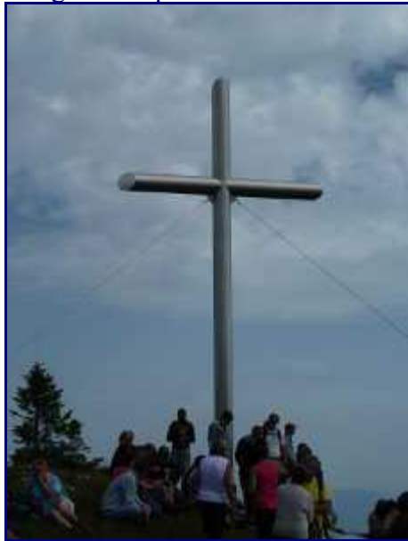
La nouvelle croix de Rossane.