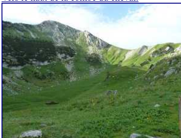
Au sommet du sentier, le Colombier (2041m) et le