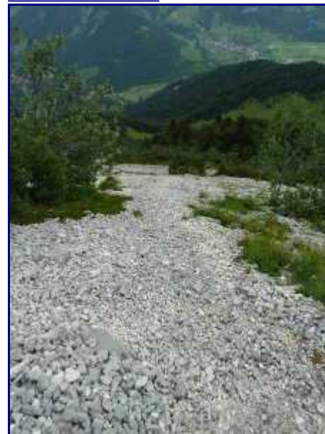
L'éboulis qu'il faut descendre. Facile avec de bonne chaussure.