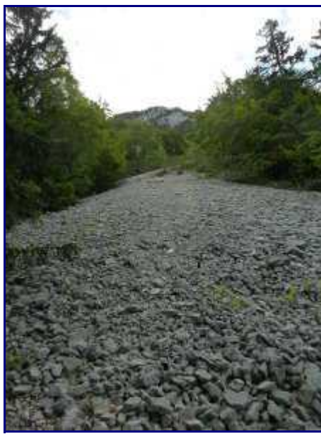
Traversée d'un éboulis / couloir d'avalanche pendant la montée de la combe du cheval.