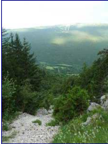
Et en contrebas du sentier, le couloir d'avalanche.

D'Aillon-le-vieux (920m), suivre le chemin agricole qui monte dans les prés.