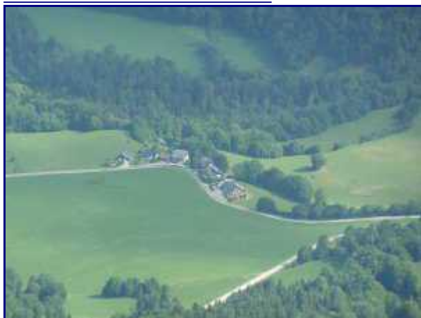
Depuis la croix de Rossane, nos gîtes (maison avec le toit gris), au milieu du hameau.

Quelques centaines de mètres plus loin, coté sud, une table d'orientation a été installée il y a quelques années.