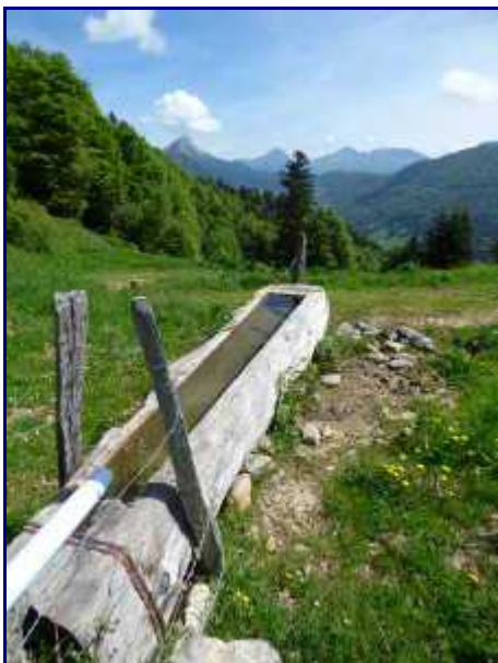
Le bassin en contrebas du chalet de la Buffaz.

NB : Lien pour télécharger le topo de la rando à la pointe de la Galoppaz , par Aillon-le-Jeune, en Pdf.