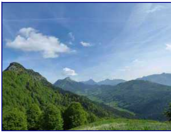
Du chalet de la Buffaz, la combe de Lourdens entre le Colombier et le mont Pelat.