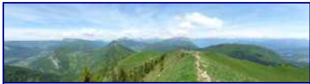
Panorama depuis la Galoppaz, versant Bauges.

Une croix en fer est érigée au sommet et une autre en bois, 100 m en contrebas, coté Chambéry.