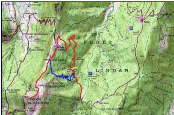
Plan de la balade à la Galoppaz. En rouge, la montée depuis le Lindar par le chalet. En bleu, variante de retour du col de la Buffaz jusqu'à la piste.

Un autre accès possible est la Galoppaz par le Col des Près , en boucle.