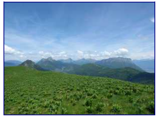
Depuis la petite Galoppaz.