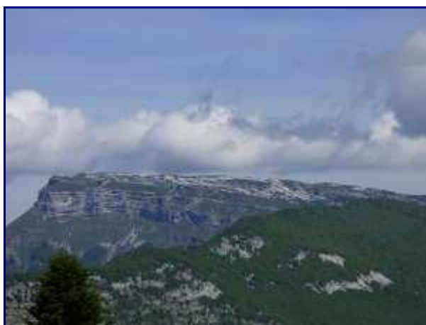
Du col de la Buffaz, Margériaz.

Les randonneurs partis du Col des Prés (autre départ possible) arrivent sur notre droite. A partir du chalet, il y a donc un peu plus de marcheurs mais c'est pas la foule non plus !