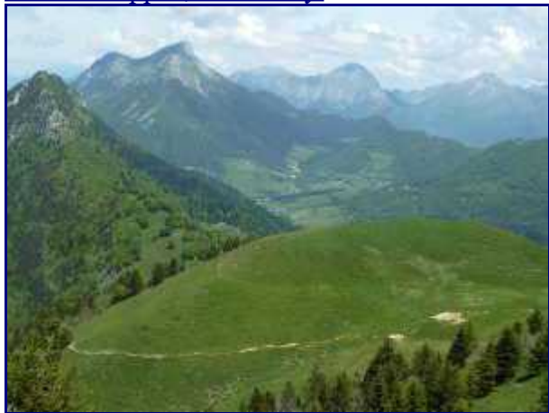
De la Galoppaz, la petite Galoppaz.

Pour redescendre, nous prenons sur le côté Ouest de la Galoppe jusqu'à la clôture en barbelés (que nous avons franchie à la montée).