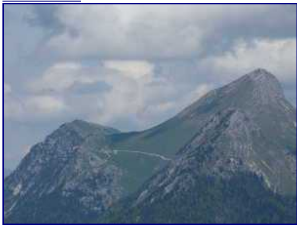
Rossanaz et le Colombier, avec la piste récente (horizontale) et l'ancienne (dessous).