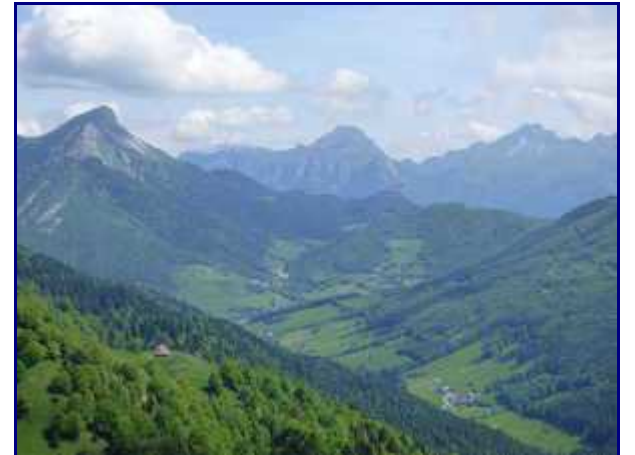
Le Colombier, Trélod et Arcalod. Dans la vallée, des hameaux d'Aillon-le-Jeune.