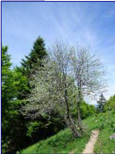
Sur le chemin du retour de la Galoppe.

En hiver, c'est un bel itinéraire à raquette, sympa à faire.