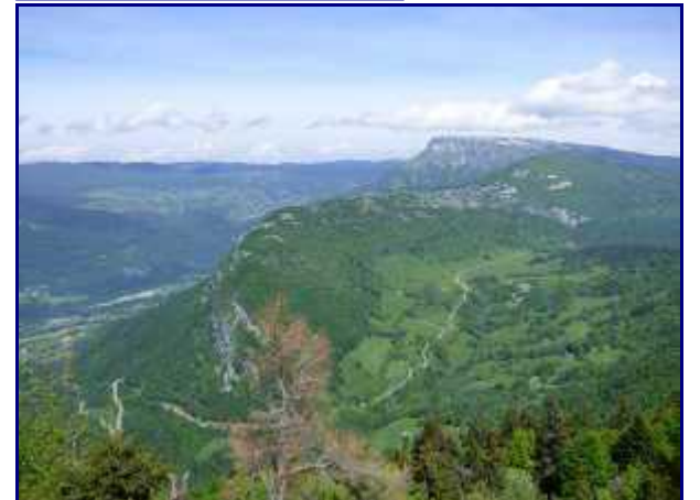
Le col des prés puis Margériaz.

En continuant au Sud, le sentier monte dans l'alpage