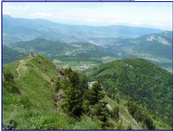
De la Galoppaz, Chambéry.