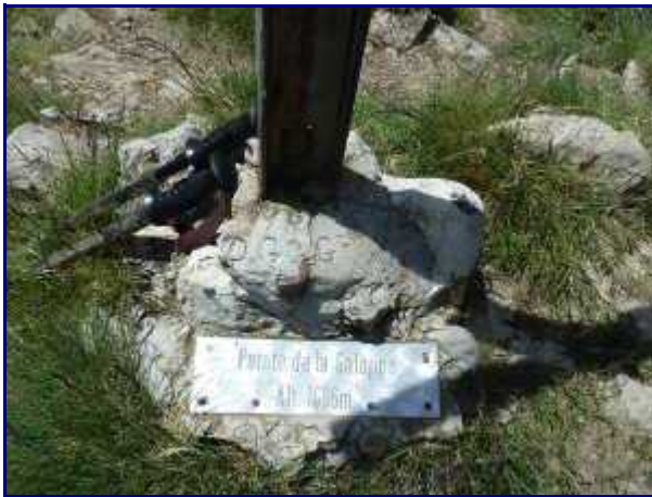
Inscription au pied de la croix de la Galoppaz.

Il nous reste alors juste à rejoindre la voiture au col du Lindar.