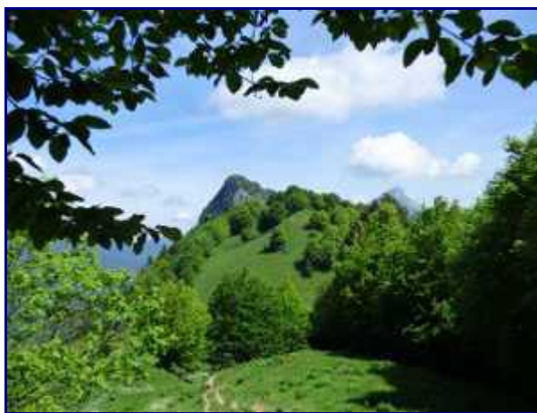
Dans le rétro, le col de la Buffaz.

En suivant la piste, on passe rapidement au Saut de la Truite, minuscule cascade et après un peu de marche, on arrive à un portail (tenir fermé !) qui indique que l'on arrive au bas d'un alpage.