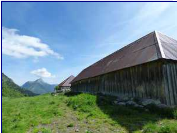
Le chalet d'alpage de la Buffaz.