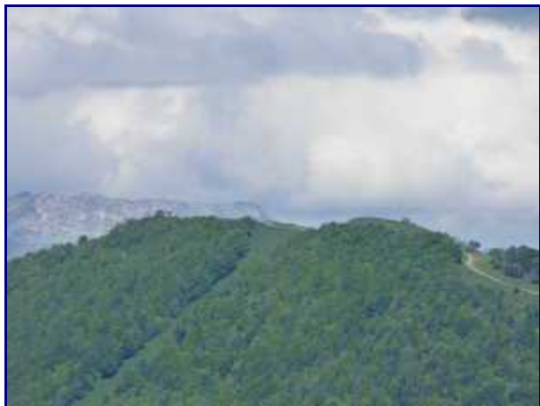
Le mont Pelat (1543m), sommet de la station d'Aillon, avec la piste noire 'les Massines' et la bleue sur la droite.

Au premier plan, le Mont Colombier et Morbié, puis la Dent d'Arclusaz à droite et à l'horizon : le Mont Trélod, les Pointes de l'Arcalod et de Chaurionde, le Mont Pécloz