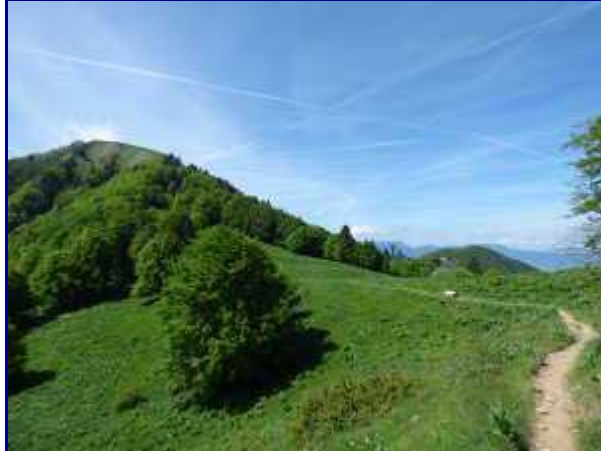
Arrivée au col de la Buffaz.

Du Col du Lindar, en suivant la piste qui permet aux alpagistes de monter au Chalet de la Buffaz, on retrouve la bifurcation avec le sentier (qui lui, vient du parking).