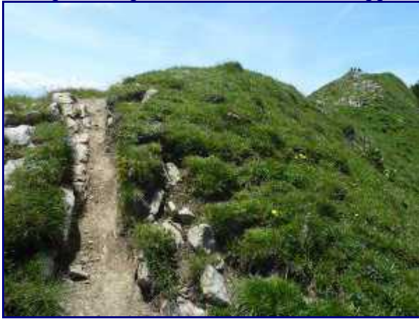
Dans le rétro.