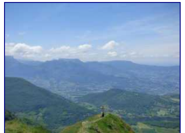
De la Galoppaz, le bassin chambérien et une partie de la Chartreuse.

Un peu plus loin, à 5-10 minutes, à partir du Col de la Buffaz (alt. 1.439 m), on commence à bien voir sur le bassin Chambérien. (Entre le chalet et le col, début juin, on peut voir de belles orchidées).