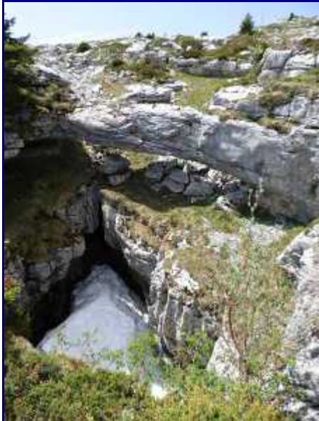
Vue sous un autre angle. Névé à fin mai 2017.