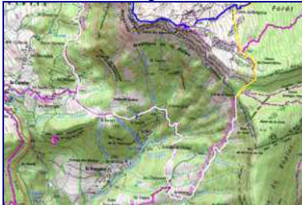
Plan de la rando à Margéziac. Partie sud.