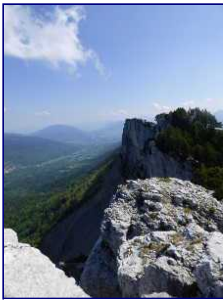
Les falaises de Margériaz, coté ouest.