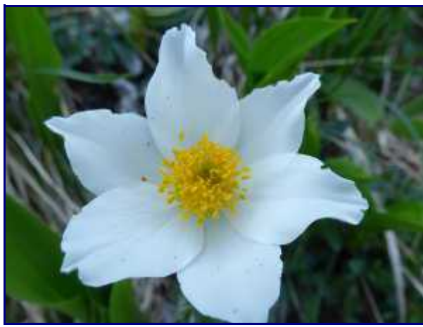
Fleur dans les pentes, sous Margéraz.