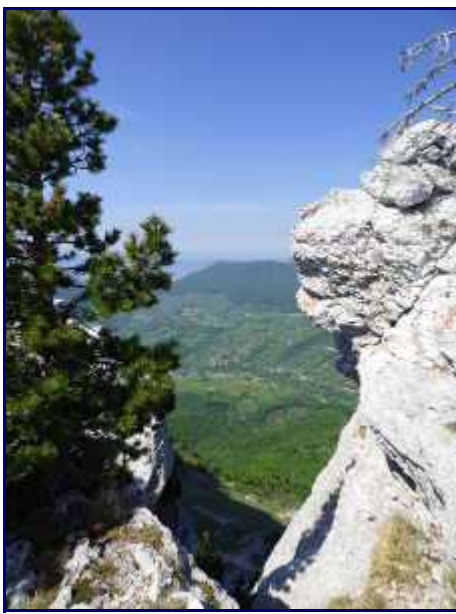
De la crête de margériaz, vue coté ouest.