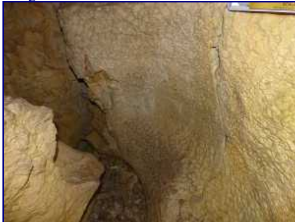
'coups de gouge' à la spéléo-rando, à Margéraz.