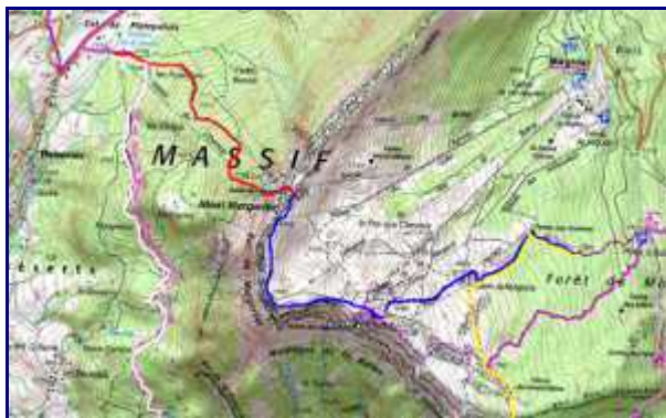
Plan de la rando à Margéziac. Partie nord.

la montée seule depuis Plainpalais jusqu'à la crête fait moins de 700 m.