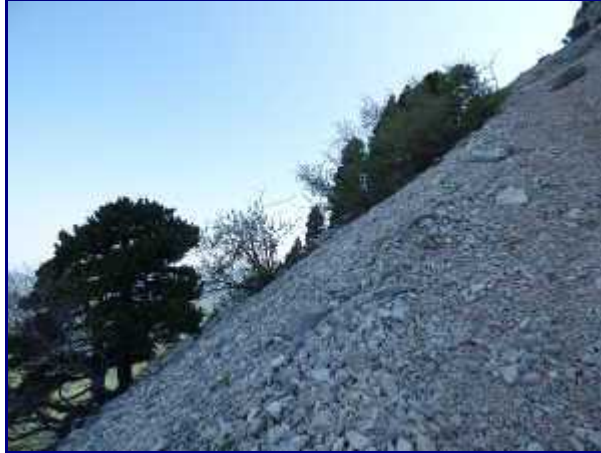
Le sentier assez pentu, dans les éboulis, sur le haut du parcours.

Sur le contrepoids du pylône est peinte une flèche bleue qui indique la direction à prendre (sur la droite en regardant la falaise).