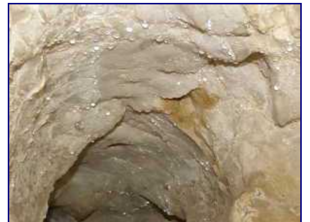
Condensation dans les méandres de la spéléo-rando.

Plus d'info avec ma page perso sur la Spéléo-Rando de Margéraz , sur ce site WEB.