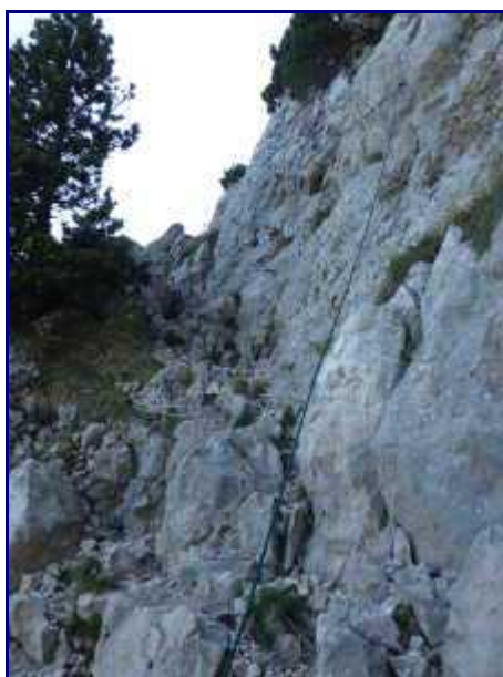
Le cable installé en contrebas de l'échelle.

A un croisement, laisser le chemin qui part sur la gauche (barré par des croix bleues) et poursuivre donc à droite le sentier devenant de plus en plus caillouteux et pentu.