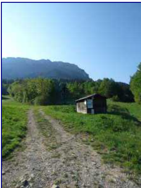
A Plainpalais, la cabane du télési.

PS : Diaporama maxi-taille en cliquant sur les photos + roulette de la souris (ou flèches) pour le défilement.