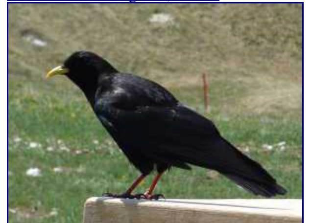
Chocard à bec jaune.

Pour vous y rendre, longer la crête jusqu'au sommet du télésiège.