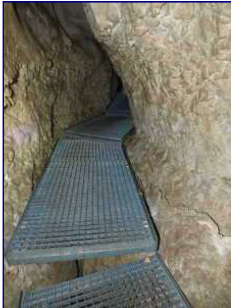
Les grilles de passage de la spéléo-rando, à Margéraz.

NB : Compter environ 1h-1h15 pour la découverte sous terre, sans la marche d'approche.