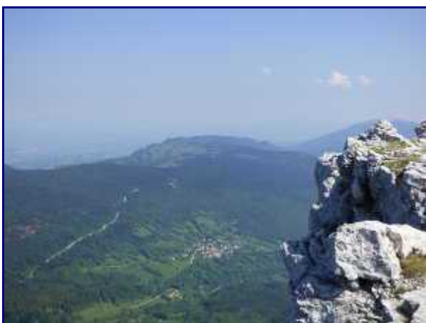
Toujours de la crête de margériaz, la Magne (hameau de St François de Sales).

La vue est très belle sur les principaux sommets du Massif des Bauges (Mont Colombier, Dent de Rossanaz, Dent d'Arclusaz, Mont Trélod, Dent des Portes) et plus loin sur ceux des Massifs des Bornes (Tournette) et des Aravis (Mont Charvin, L'Étalle) ainsi que la Chaîne du Mont-Blanc.