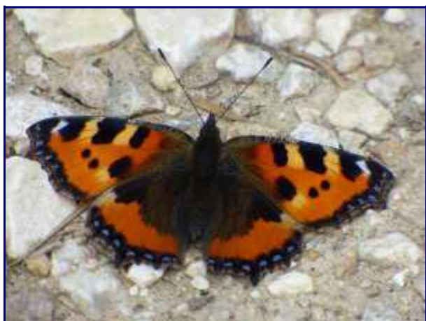
Papillon au sol.

Les planeurs décollant de Challes-les-Eaux viennent vers les crêtes de Margéziac. L'exposition est sud et les courants thermiques doivent être bons.