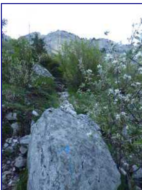
Marque en bleu (ici, une flèche) tout le long du sentier.

Cet unique remontée fait partie du domaine skiable alpin de Savoie Grand Revard.