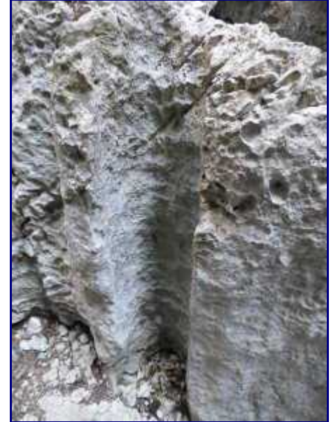
Erosion cylindrique verticale. 20 cm de diamètre sur 1 m de haut.

Monter dans le pierrier jusqu'au pied de la falaise.