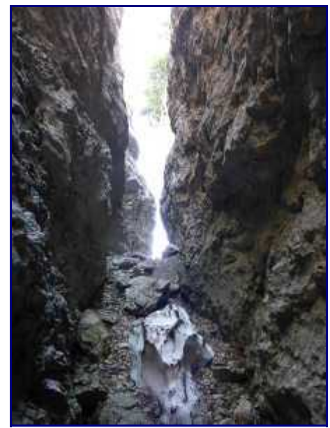
A la sortie du passage, un petit névé (fin mai).