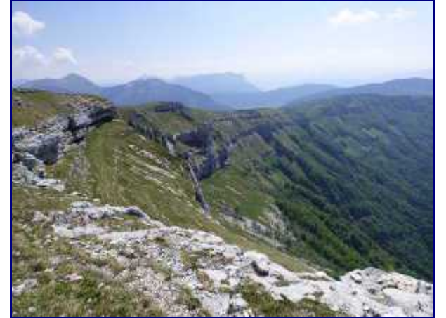
Les falaises de Margériaz, au sud.