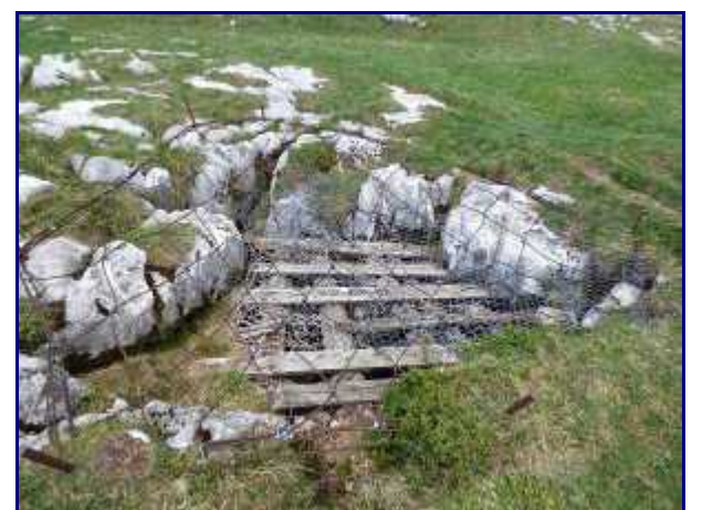
Goufre sécurisé sur les sommets de Margériaz.

Un 1er goufre fermé et sécurisé n'est pas loin de l'arrivée mais il faut filer encore vers le sommet du télésiège de la bergerie.