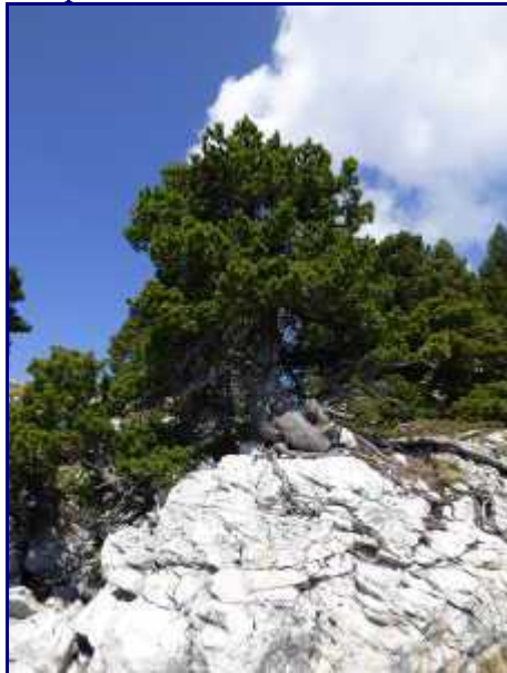
Arbre tortueux sur le sol caillouteux calcaire.