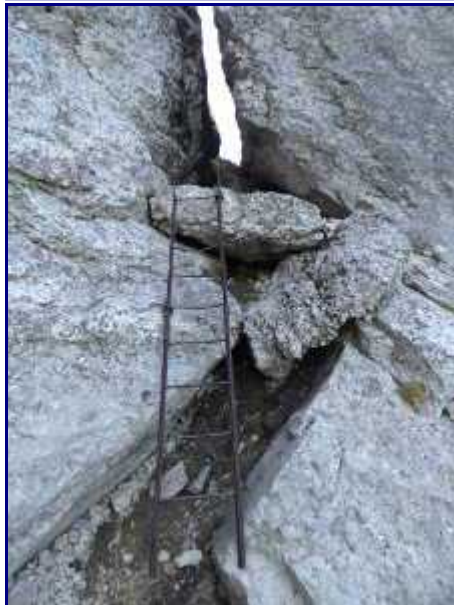
Echelle du trou de l'agneau, à Margéraz.