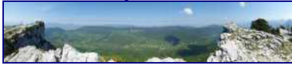
Panorama vers l'ouest depuis la crête de Margériaz.