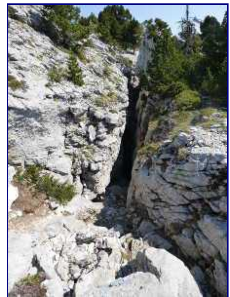
La faille d'arrivée du trou de l'agneau, à Margéraz.

Fin mai, il restait encore un petit névé.