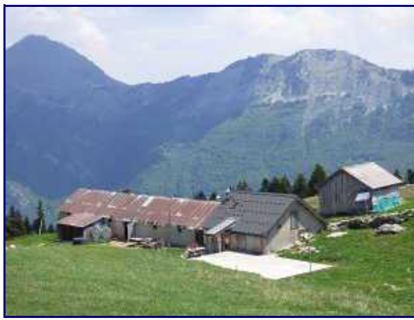
Le chalet-bergerie de Margéraz.

Comme pour les lapiaz (ci contre, à crêtes aiguisées car ils ont évolués à découvert), le temps passe à l'échelle des millions d'années.