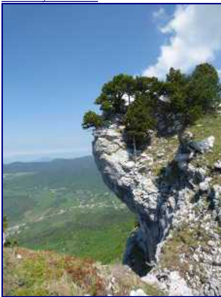
Du sommet de Margériaz, vers le nord-est.

On débouche entre les arrivées des téléskis du golet et de l'agneau, à proximité de ce dernier.