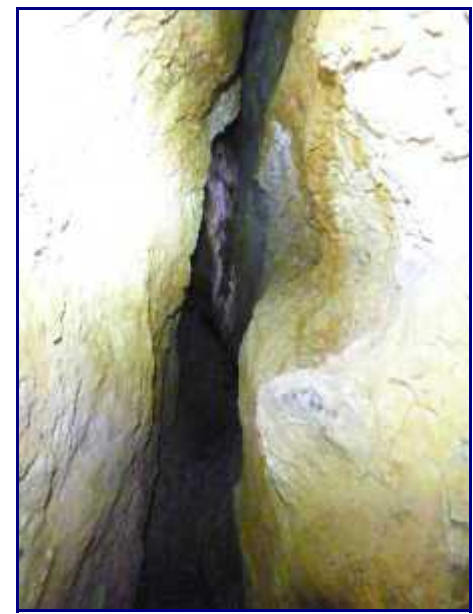
A Margéraz, un boyau étroit de la spéléo-rando.

De la névière du pont de pierre, descendre au chalet de la Bergerie puis rejoindre le sentier balisé des 'Tannes et glacières'.