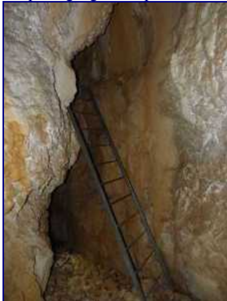
échelle d'accès à la spéléo-rando, à Margéraz.