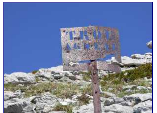
Le panneau du trou de l'agneau, à Margéraz.

Important : Au pied de la falaise, la voie du 'Trou de l'Agneau', sur la droite, est d'accès plus difficile (vide / escalade de bon niveau / rocher friable) et réservé aux marcheurs expérimentés et sûr d'eux.