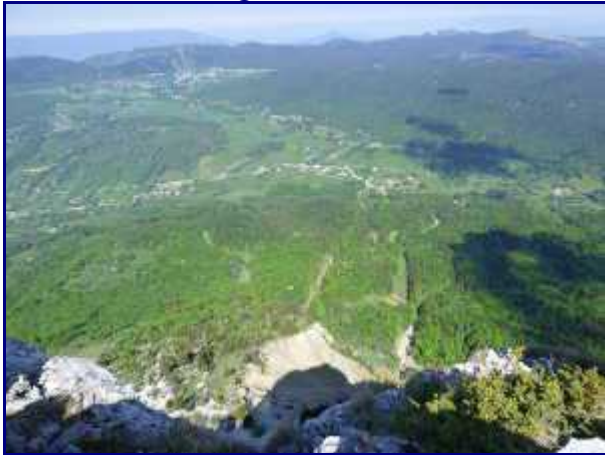
De la crête de margériaz, le col de Plaimpalais et la Féclaz, en face.