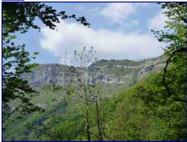
Les falaises de Margéziac, depuis les 'Chavonnes'.