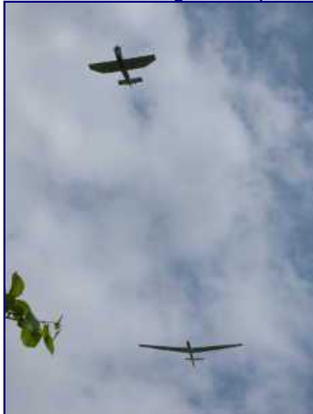
Avion tractant un planeur depuis Challes-les-Eaux.

Il faut donc remonter le 'sentier des tannes et glaciers' vers l'alpage, laisser la bergerie sur votre droite puis prendre au sud le sentier bien marqué qui mène au col de la Verne (1520m).