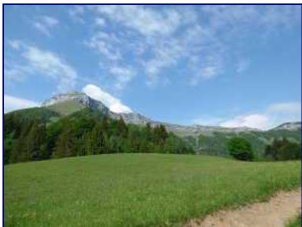
Les falaises de Margéziac, depuis le Fornet.

Du col, descendre vers la Sétéria (920m, point bas de la boucle) par un beau sentier en forêt. C'est le GR96 du massif des Bauges.