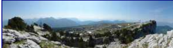
Panorama vers l'est depuis la crête de Margériaz. De chaque coté, les arrivées des téléskis.