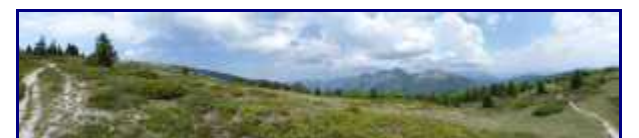
En s'approchant du col de la Verne, panorama.

En fait, on part plein sud pour contourner les falaises de Margéraz, pratiquement à l'opposé du point de départ !