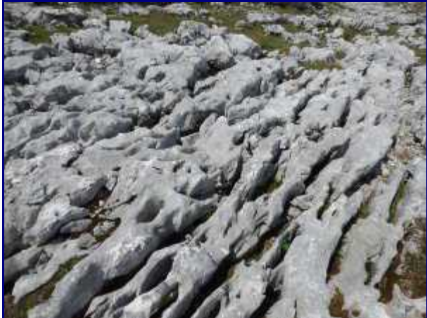
Les lapiaz aiguisés de Margéraz.

Auparavant, tout ceci était souterrain mais l'érosion a fait son lent travail de mise à jour.