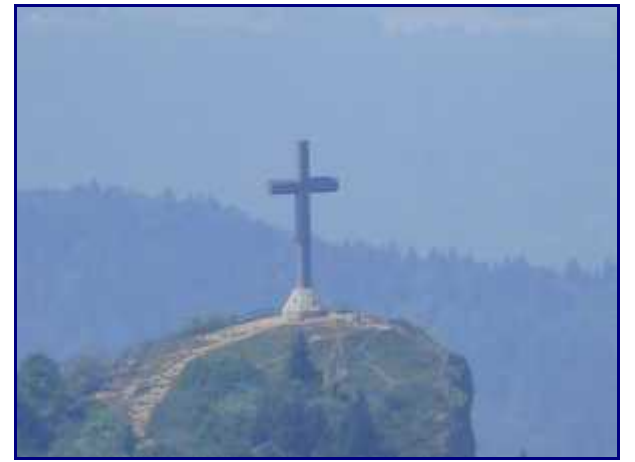
La croix du Nivolet, depuis le sommet de Margériaz.

l'arche et la névière du Pont de Pierre, une des curiosités géologiques remarquables à ne pas rater !