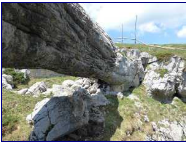
'Pont' de pierre, à Margéraz. coté nord.

Marcher en direction de la falaise pour trouver cette arche (entouré d'une barrière de bois).