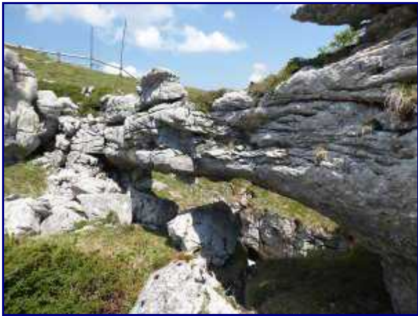
'Pont' de pierre, à Margéraz. coté sud.

A la fin mai 2017, il subsiste encore un bon névé sous l'arche malgré un hiver peu neigeux.