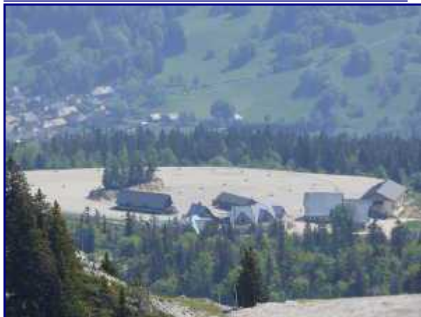
Les batiments du stade de neige de Margériaz (fin mai 2017).