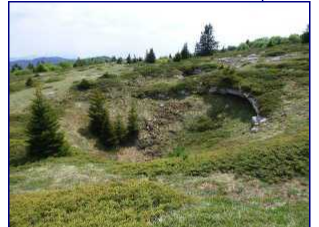
Doline sur les hauteurs de Margéraz.

De la spéléo-rando, le retour peut se faire comme à l'aller via le golet de l'agneau et descente sur Plaimpalais.