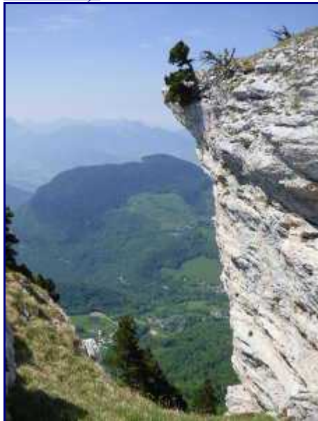
Les 'déserts' depuis les crêtes de Margériaz.