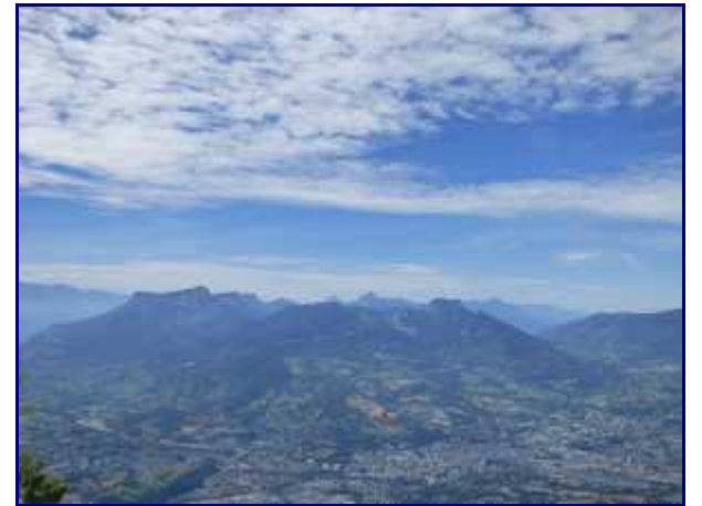
La cluse de Chambéry et la Chartreuse, en arrière plan.

présente pas de difficulté. Il suffit d'être prudent. L'installation plus bas d'une main courante facilite le cheminement.