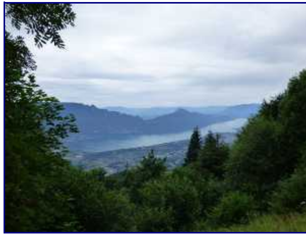
Le lac d'Aix, vue de sous la falaise du Nivolet.

L'installation est complètement refaite, depuis Verel Pragondran, en 1989, 3 ans avant les JO d'Albertville.