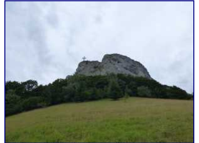
La Croix, vu du lieu dit 'les grands prés'.