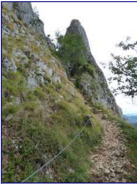
Le pas de l'échelle, d'en bas avec la main courante.