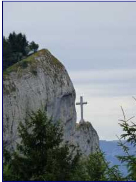
La Croix du Nivolet, depuis le Sire.

Autre accès à la croix du Nivolet par le Sire.