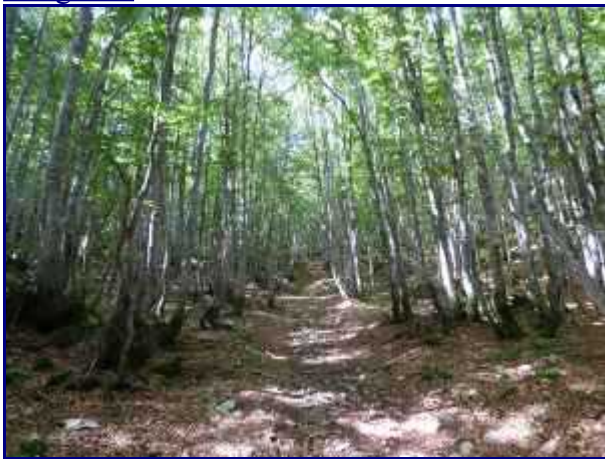
Le chemin, en forêt, vers la croix du nivolet.