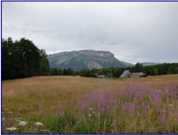
Les chalets de Glaize (alt 1297 m). En face, Margériaz

Le sentier le plus emprunté reste celui 'par les Crêtes' qui est très fréquentée, surtout l'été et le dimanche.