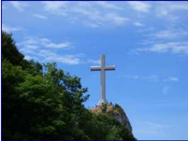
10 minutes avant la croix, point de vue en retrait du chemin.