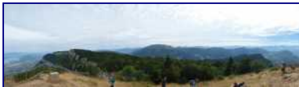
Panorama depuis la Croix du Nivolet, côté Bauges.

Le chemin rejoint le sentier qui passe par les crêtes un quart d'heure avant la croix.