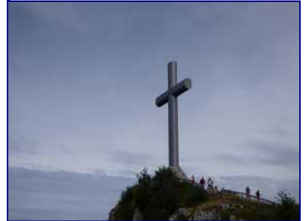
La Croix du Nivolet, du Pas de l'échelle.