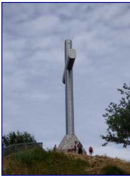
La Croix du Nivolet (alt 1547 m).

NB : Lien pour télécharger la balade à la croix du Nivolet , au départ de Glaize, en Pdf.