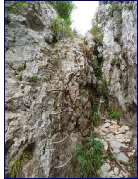
En aval du pas de l'échelle.

De sous la croix, au lieu dit 'les grands prés', le chemin part presque à plat.