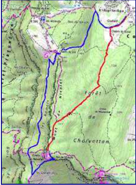
Plan de la rando à la croix du Nivolet. En rouge, montée et aller par le sentier classique. En bleu, retour par le sentier sous la falaise.