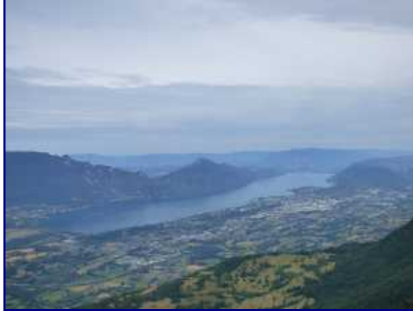
lac d'Aix, vu de la croix du Nivolet.