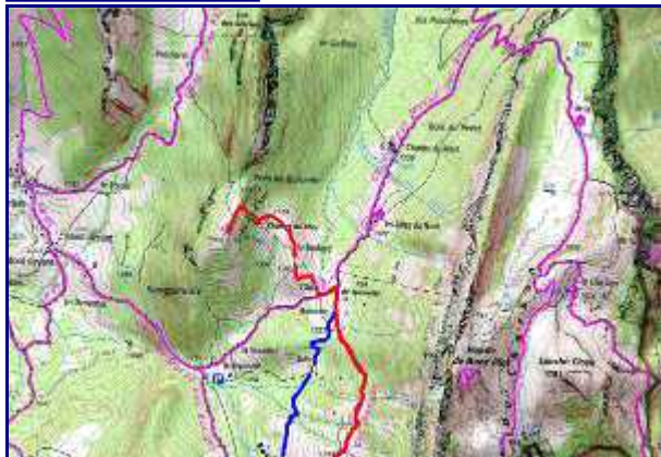
Plan de la balade (nord). En rouge, l'aller et en bleu, la variante du retour.