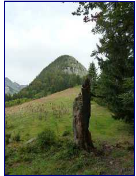
Le Roc de Four Magnin.

Le sentier monte dans la forêt pour rejoindre le sommet du Crêt.