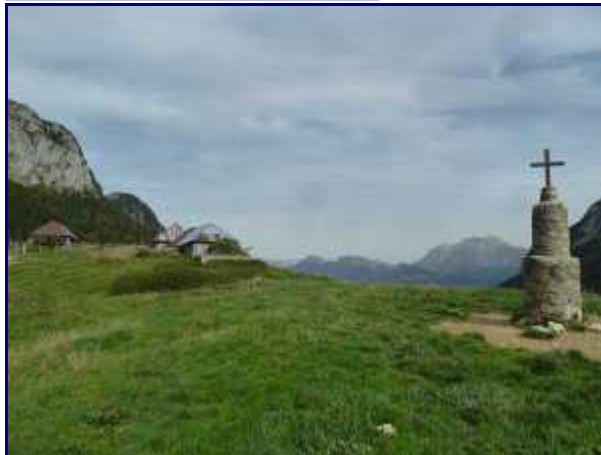
La croix et le chalet du Mollard.

Du col, passez au chalet du Mollard et sa croix.