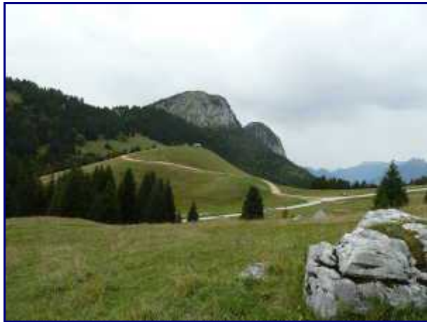
Au retour, vue arrière sur le col de Bornette et le chalet Mollard.

Du bas du Crêt du Char, nous avons donc pris plein sud, vers notre point de départ.