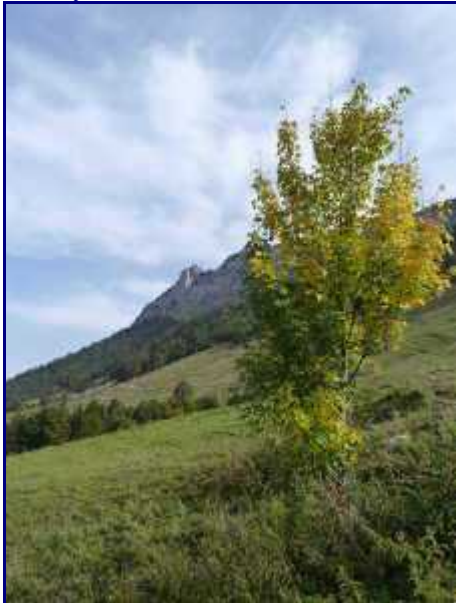
Au golet de Doucy.