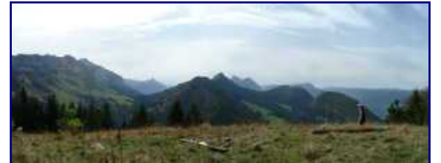
Panorama au sommet du Cret du Char.

Le sentier monte dans la forêt pour rejoindre le sommet du Crêt.