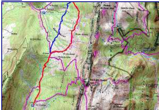
Plan de la balade (sud). En rouge, l'aller et en bleu, la variante du retour.