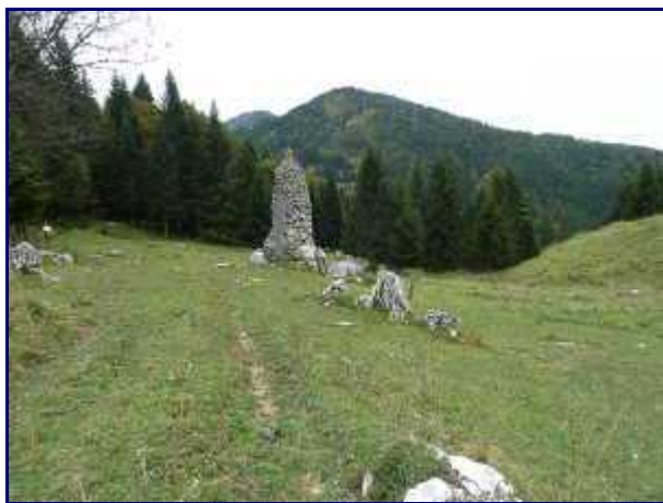
La stèle sur le chemin du retour.

On peut, sinon, passer par le reposoir (1165m) et rejoindre le parking par le GR du Tour des Bauges.