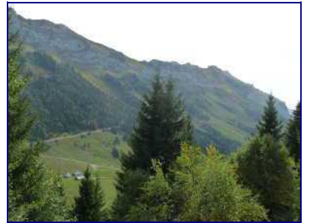
Dans le rétro, pendant la montée du Cret du Char.

A hauteur du chalet, on voit bien le lac d'Annecy et les sommets environnants.