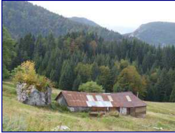
Le chalet de Bornette.

Du Golet, on peut bien sûr monter à la Dent des Portes puis au Trélod mais cette fois, on va se la jouer tranquille et on se contente de partir en direction du col de Bornette.