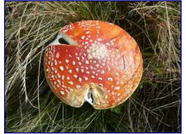
Une belle amanite tue mouche.