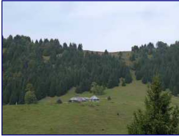
Le chalet du Mollard, sous le Cret du Char.

Juste avant le col de Bornette, on passe en amont du chalet du même nom. Les anciens l'ont construit à l'abri d'un rocher aux dimensions imposantes.