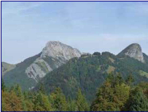
Le Crêt du Char (au 1er plan) depuis le Golet de Doucy.

NB : Lien pour télécharger la balade du Crêt du Char , au départ de Doucy, en Pdf.