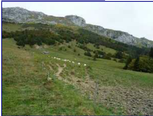
Au golet de Doucy. La dent des Portes et le chalet du Golet.