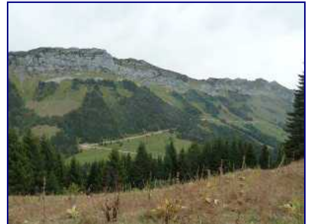
Banc Plat. Et la nouvelle piste qui rejoint le chalet des écuries derrière.