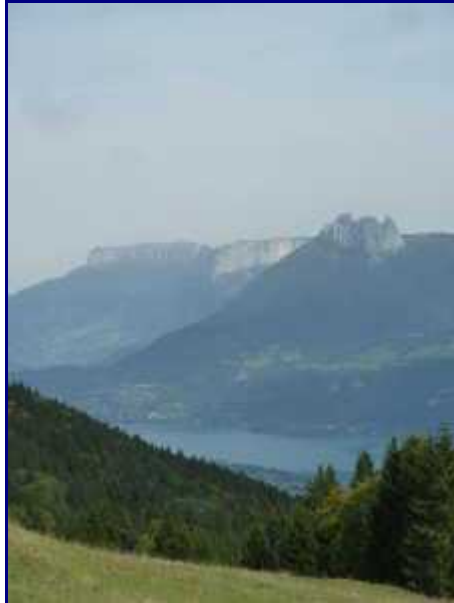
Du chalet du Mollard, vue sur le lac d'Annecy, Parmelan et dents de Lanfon.