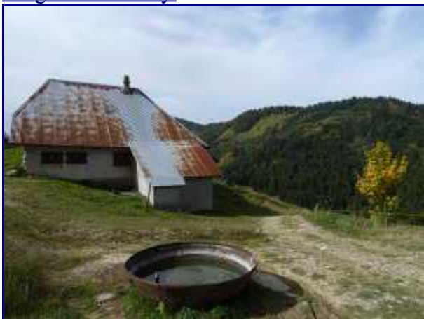
Le chalet des écuries devant, à Doucy.