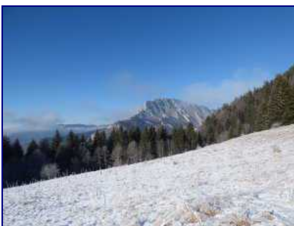
Le roc des Boeufs du sommet du Cret du Char.

Sous les chalets de Précheret (1290m – panneaux), prendre sur votre gauche, plein sud, vers la forêt.