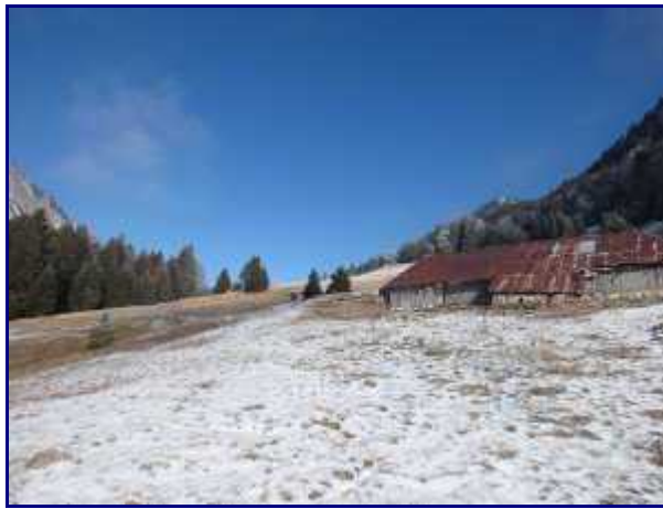
Le chalet de Précheret.

Au centre du hameau, laisser à gauche la direction du Col de Leschaux et des Chalets du Sollier pour prendre à droite le Sentier du Char.