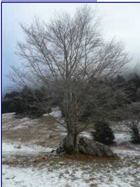
En montant en direction de Précheret, avant le col de la Frasse.