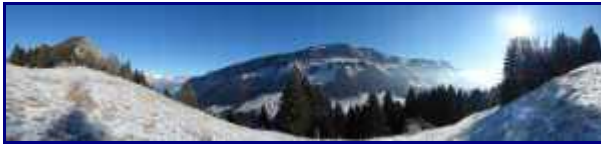
Et panorama vers l'est du sommet du Cret du Char.