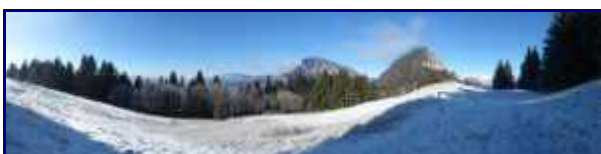
Panorama vers l'ouest du sommet du Cret du Char.

Je ne sais pas depuis quand il n'y a plus de vaches laitières.