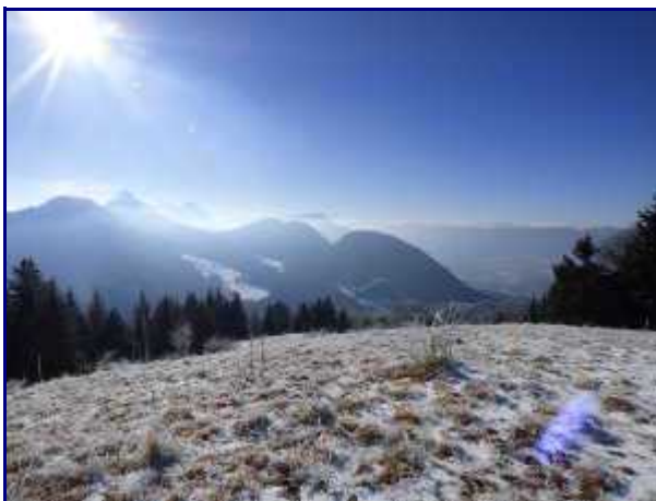
Les Bauges vers le Julioz, Colombier, Margériaz...

Ce chalet d'alpage est resté tel qu'il était lors des saisons d'alpages dans les années 1980-90.