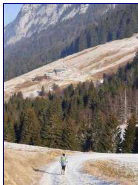
En descendant vers le col de Bornette (1316m). En face, le chalet des Ailes du Nant.

Traverser l'alpage pour rejoindre le Col de Bornette (1304m).