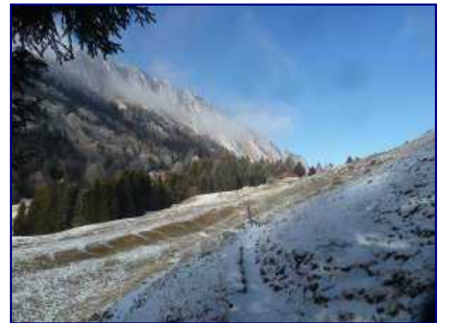
Le roc des Boeufs (1774m).

Merci pour lui de ne rien dégrader. Un carnet est sur la table, vous pouvez y laisser un mot.