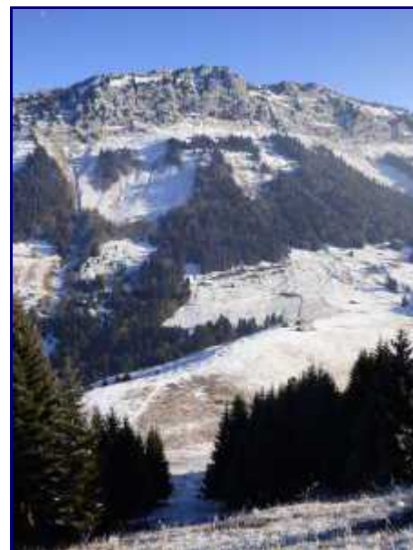
Le chalet du Mollard et la pointe de Banc Plat (alt 1907m).

Le point de vue indiqué sur la carte IGN est plus au sud avec le Julioz, Colombier, Dent de Rossanaz et Margériaz.