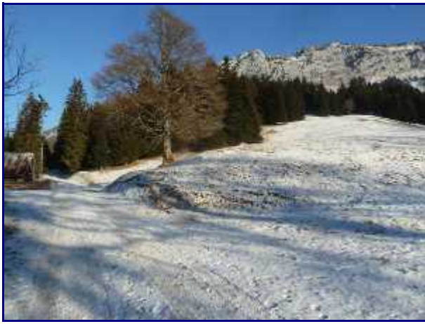
Le noubloz, entre le col de Bornette et le reposoir.

Suivre sud-ouest le sentier qui mène au Reposoir (1165m), parking pour le départ de Banc Plat (1907m).