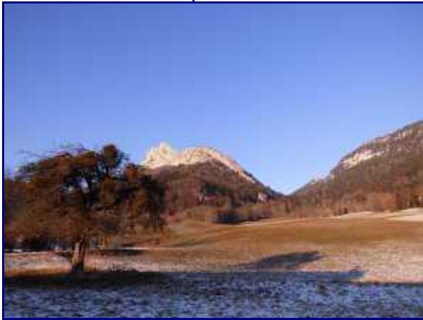
Le roc des Boeufs (1774m).

Rester sur la route pendant 500m environ puis prendre à gauche le sentier qui coupe à travers bois et qui ramène au Hameau de Mont devant.