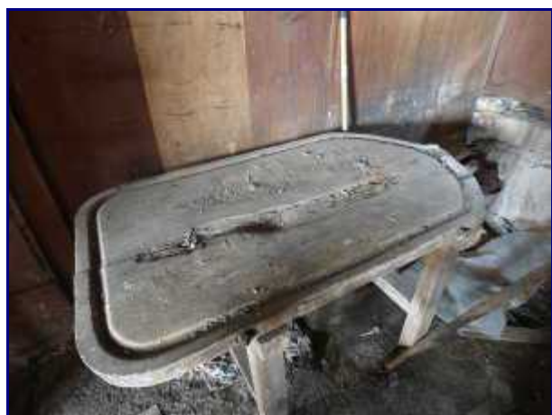
La table pour égoutter les tomes et fromages après moulage au chalet du Précheret.

Sur le coté, la table pour égoutter les tomes une fois faites. Le petit lait était récupérer pour faire du sérac (fromage maigre) ou pour engraisser les cochons.