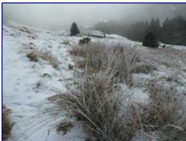
Vue arrière sur le chalet du Précheret, pendant la montée au col de la Frasse.

On traverse les prés puis longe le bois avant de déboucher dans le bas de l'alpage.