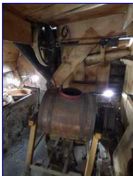
La baratte pour fabriquer le beurre. Chalet du Précheret.

Sur le coté gauche, contre le mur du chalet, le bac à saumure pour saler tomes et fromages.