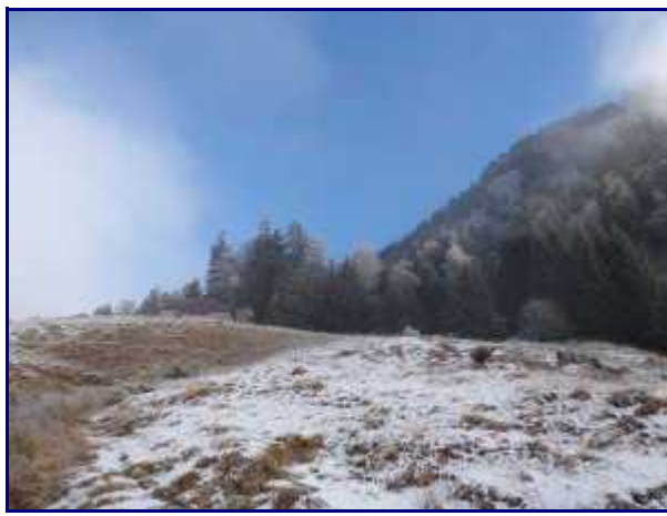
Le chalet de Précheret.

Du parking (1010m), monter vers le village de Mont-Derrière.