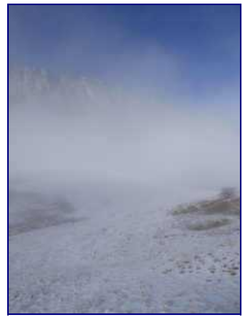
Arrivée au col de la Frasse, dans la brume qui peine à se disperser.

Monter plein nord. Aux chalets de Précheret (1310m), continuer vers le col de La Frasse (1379m, AR en 45 mn environ).