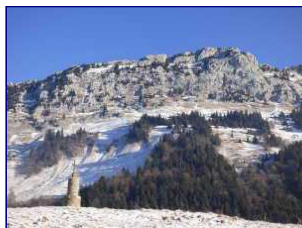
La croix à proximité du chalet et Banc Plat.

Pendant la descente, en face, les Chalets d'alpage du Mollard et des Ailes du Nant. Au dessus, la pointe de Banc Plat . Un conseil, allez y, vous ne serez pas déçu.