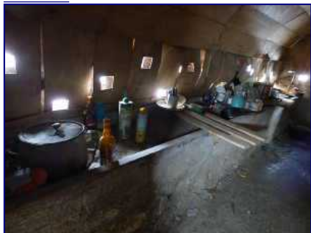
Une fois formés, les tomes et fromages étaient salés dans le bac à saumure, tout en longueur. Chalet du Précheret.