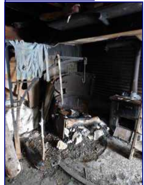
La chaudière du chalet du Précheret. A gauche, la potence qui tenait la cuve à lait.

Hormis le fait que vous pourrez vous abriter du vent, comme aujourd'hui, vous aurez tout le loisir d'observer cet ancien chalet d'alpage.