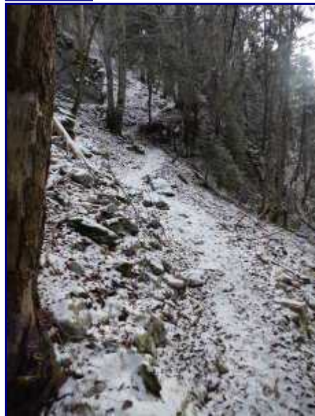
Sentier de montée au crêt du Char, coté Bellecombe.