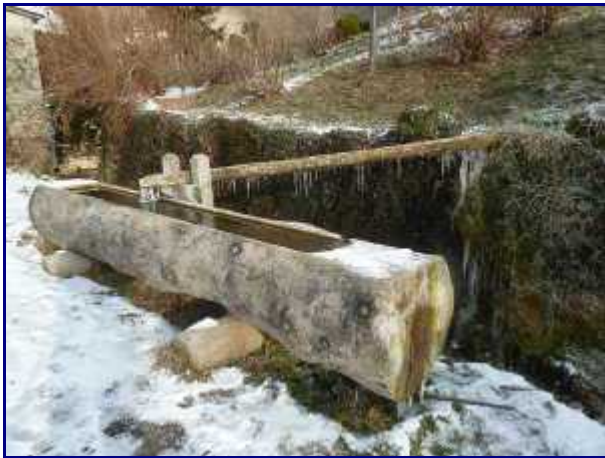
Bassin au mont derriere.

Se garer entre le Mont-Devant et le Mont-Derrière en bord de route.