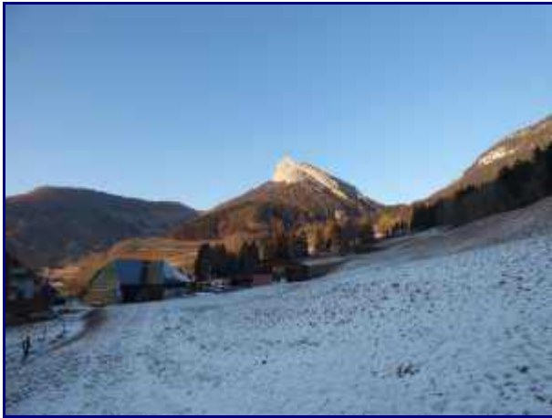
Le roc des Boeufs depuis le mont devant.