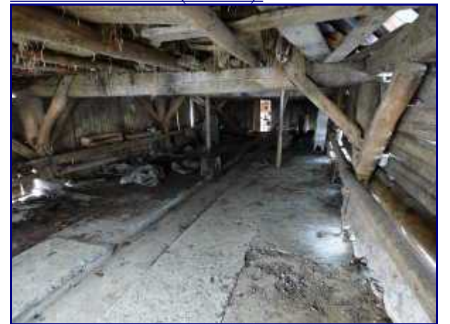
L'écurie du chalet du Précheret. Les vaches étaient attachées à droite et à gauche. Au milieu, la rigole pour évacuer le fumier.