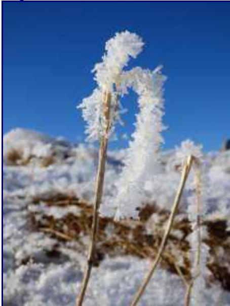
Givre au sommet du cret du Char - mi janvier 2017.

Suivre le sentier, sans difficulté, jusqu'à la croupe du Crêt du Char (1463m).