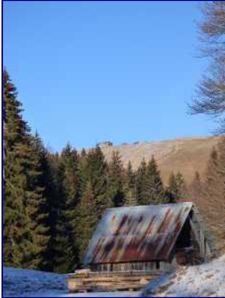
Le chalet du Mollard, sous le cret du Char, depuis le noubloz.

Suivre sud-ouest le sentier qui mène au Reposoir (1165m), parking pour le départ de Banc Plat (1907m).