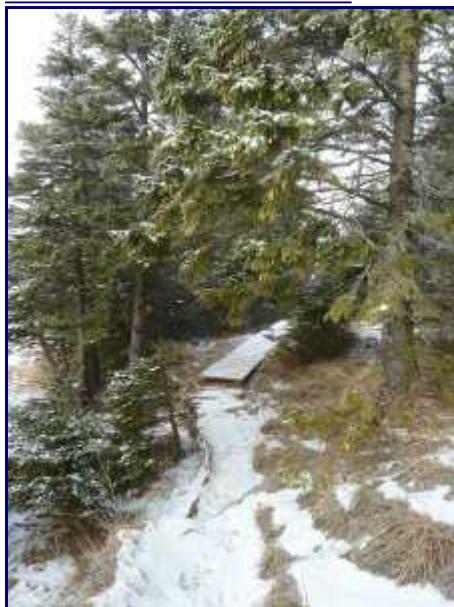
Passerelle sur le sentier du col de la Frasse.