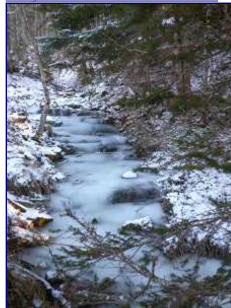
Ruisseau gelé, entre le col de Bornette et le reposoir.